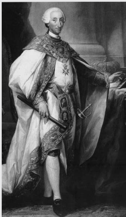
Il. 10 Karlos III (1759-88) (od Sánchez-Albornoz 1971, korice)

Karlos III (1759-88), osim što je smanjio previše naraslu moć monaškog reda, odbacio je staromodne i ograničavajuće zakone i izvršio i infrastrukturnu obnovu. On je takođe upamćen kao kralj koji je stanovništvu Madrida zabranio da bacaju đubre kroz prozore ili, npr. uveo je i božićne postavke u duhu napuljskih modela. Činjenica je da je konačno naredio da se „Cigani” oslobode iz zatvora praktično nepoznata je javnosti.