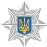
Національна поліція України