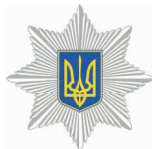
Національна поліція України