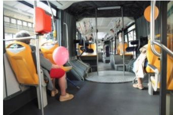
met de bus, tram, metro