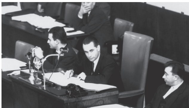
Jacques Chaban-Delmas (Francuska), prvi predsjednik Konferencije lokalnih vlasti, 12. januar 1957.

1994. počelo je novo poglavlje u razvoju lokalne i regionalne demokratije osnivanjem sadašnjeg Kongresa lokalnih i