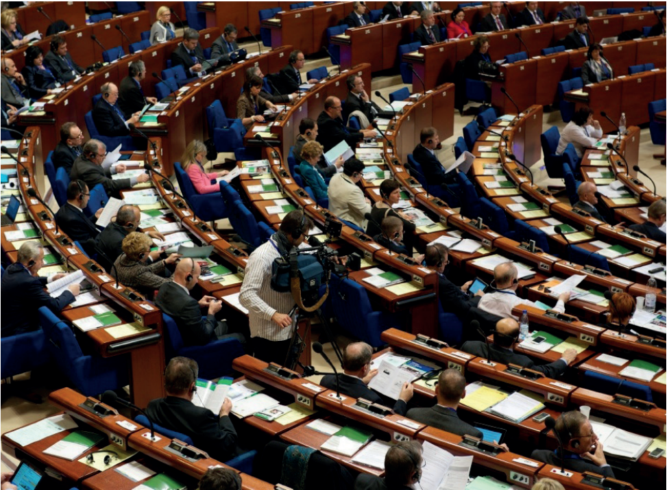
Sastanak 612 izabranih predstavnika lokalnih i regionalnih vlasti na plenarnoj sjednici u Strazburu (Francuska).

Kongres ima dva doma: Dom lokalnih vlasti i Dom regija. Ima 306 punopravna i 306 zamjenska člana, koji se imenuju na četiri godine i predstavljaju više od 130.000 lokalnih i regionalnih vlasti iz 46 zemalja članica Vijeća Evrope.