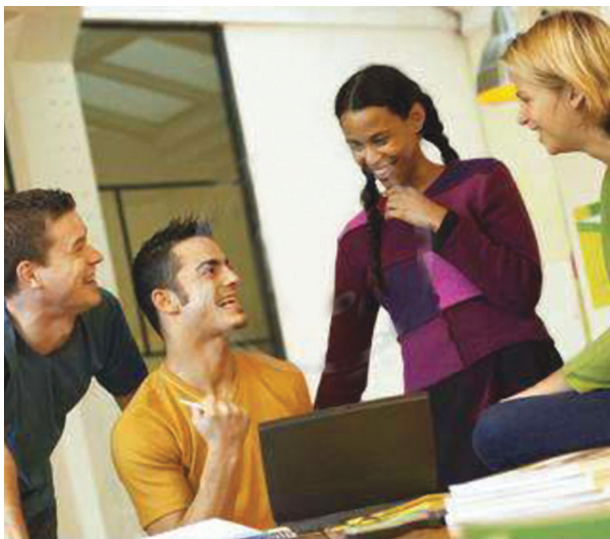
GenĀliĀin katılmı Kongrenin öncelikleri arasındadır.

Kongres je formirao i Stalni odbor koji se sastoji od šefova svih državnih delegacija i 17 članova Biroa, koji djeluje u ime Kongresa u periodu između zasjedanja.