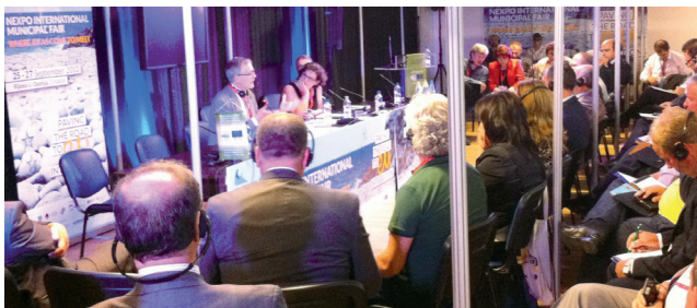
Kongres je organizovao učešće predstavnika Albanije na međunarodnom sajmu općina NEXPO 2013 u Hrvatskoj.

Kongres je ojačao saradnju i partnerstva sa zemljama članicama i drugim institucijama i evropskim udruženjima u cilju učvršćivanja teritorijalne demokratije. Predlažu se aktivnosti u ovoj oblasti da bi se dodatno osigurala primjena Evropske povelje o lokalnoj samoupravi i preporuka Kongresa.