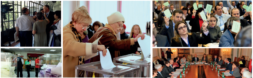
Posmatranje lokalnih i regionalnih izbora i praćenje primjene Evropske povelje o lokalnoj samoupravi dva su prioriteta Kongresa

lokalne i regionalne demokratije u određenim zemljama, a posebno o primjeni Evropske povelje o lokalnoj samoupravi. Zemlje članice su na osnovu tih nalaza pokrenule brojne zakonodavne reforme.