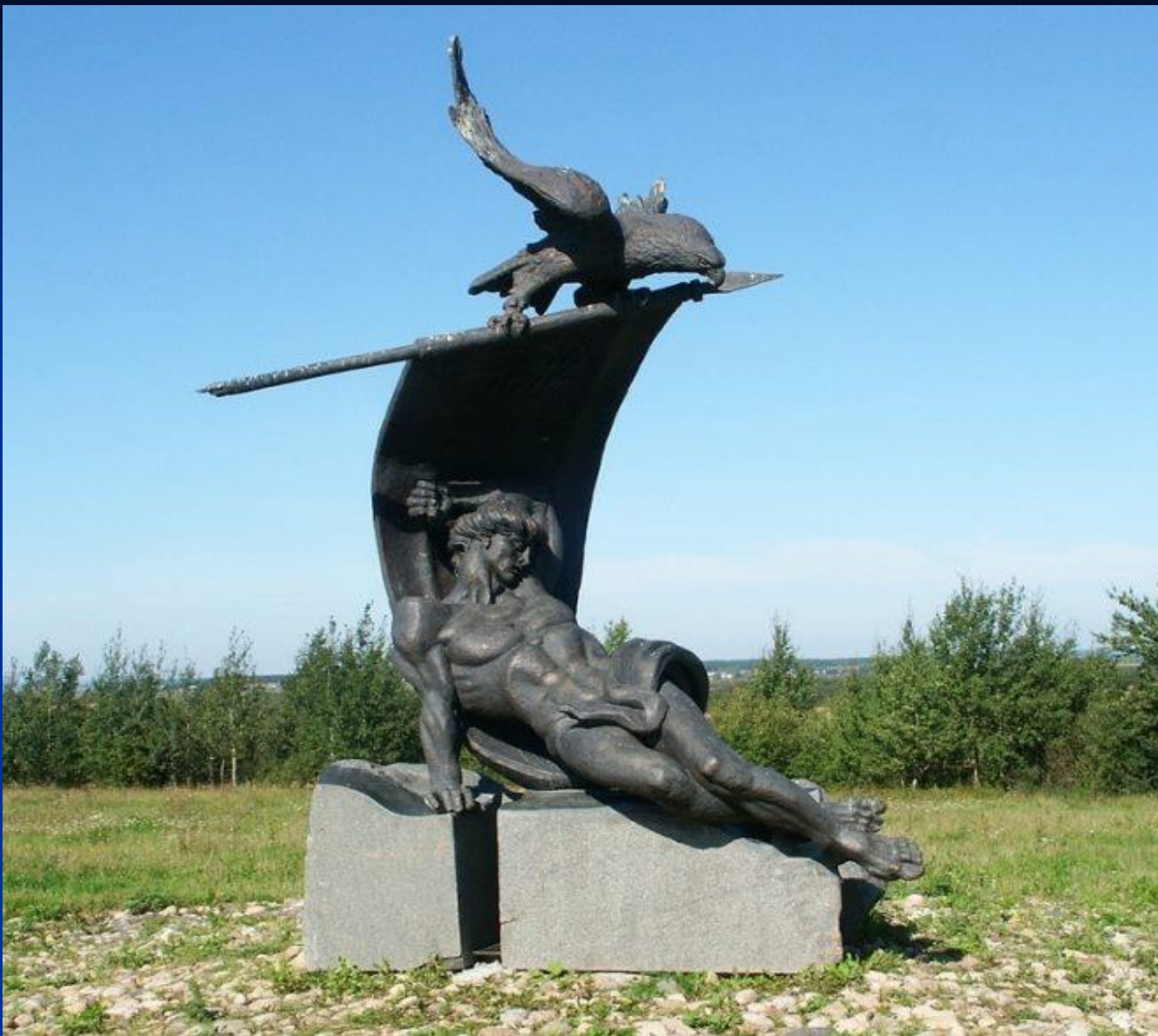
Авторы памятника – скульптор А.Е.Артимович, архитектор И.В.Морозов