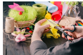
relativi ad arti e mestieri