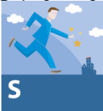
S - სოციალური

პრობლემებთან შეჯახებისას რეკომენდაციები მოქმედების სხვადასხვა მიმართულებებს გვთავაზობს. ამ დროს იყენებს დისციპლინათაშორის და ფართო ჩართულობის მიდგომას, რათა სტრატეგიის სამი კომპონენტიდან თითოეულზე იმოქმედოს. თითოეულ რეკომენდაციაში მაგალითებად მოყვანილია საუკეთესო გამოცდილება: