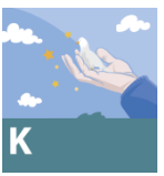
K – ცოდნა და განათლება