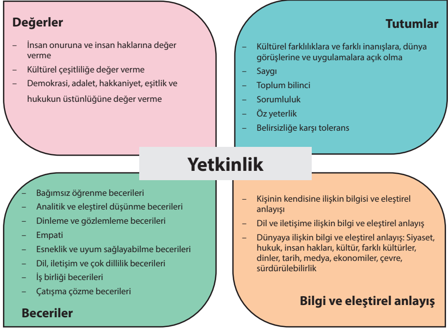
Şekil 1: Yetkinlik modelinde yer alan 20 yetkinlik

Model, demokratik kültür ve kültürlerarası diyalog bağlamında, bir bireyin demokratik ve kültürlerarası durumlarda karşılaşılan gereklilikler, zorluklar ve fırsatlar karşısında bu 20 yetkinliğin bazılarını veya tamamını kullandığında yetkin davrandığını öne sürmektedir. Aşağıda, dört grup yetkinlik ve her bir grupta yer alan bireysel yetkinlikler ayrıntılı bir biçimde açıklanmıştır.