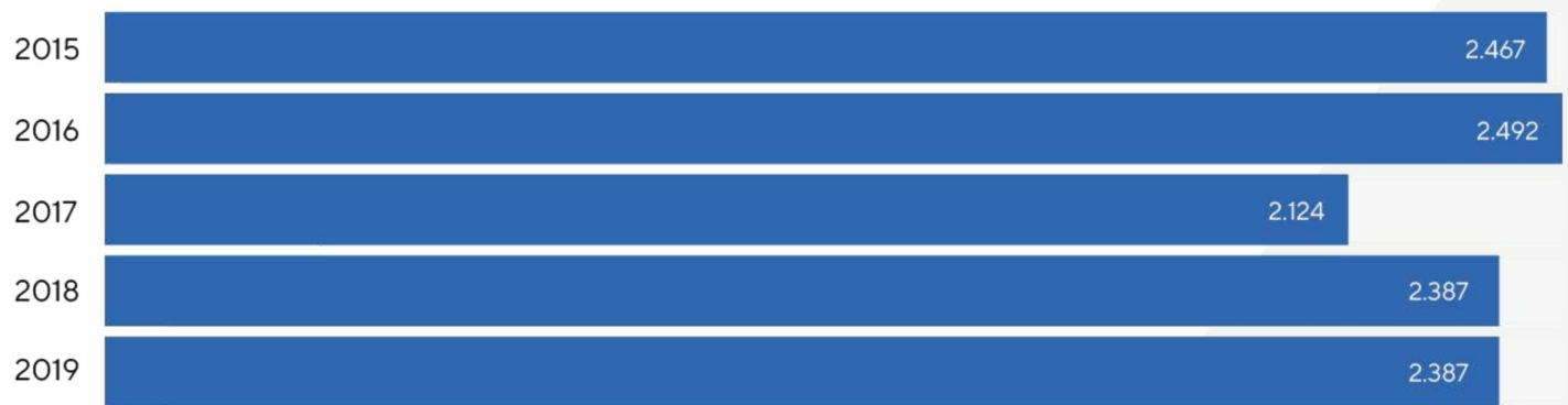
Рисунок 1: Загальна потреба в коштах ПАТ “НСТУ” зазначена у бюджетних запитах, 2015–2019 роки