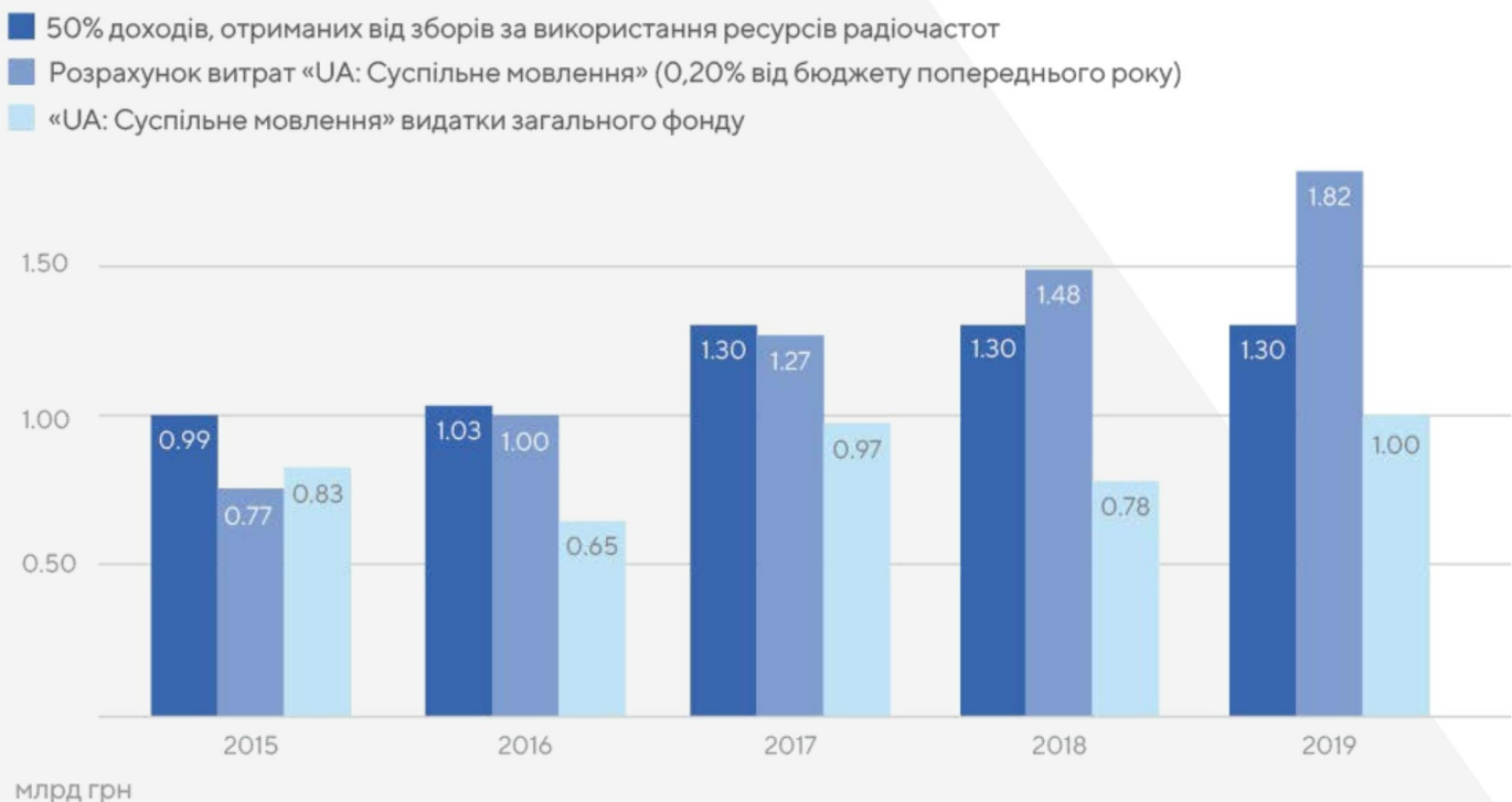
Рисунок 2: Фінансування «UA: Суспільне мовлення»: поточне та нове, реальні та прогнозовані видатки на 2015–2019 роки

Наведена нижче діаграма порівнює вплив поточного фінансування, модель, встановлену законом, і прогнозовані доходи запропонованої моделі фінансування.