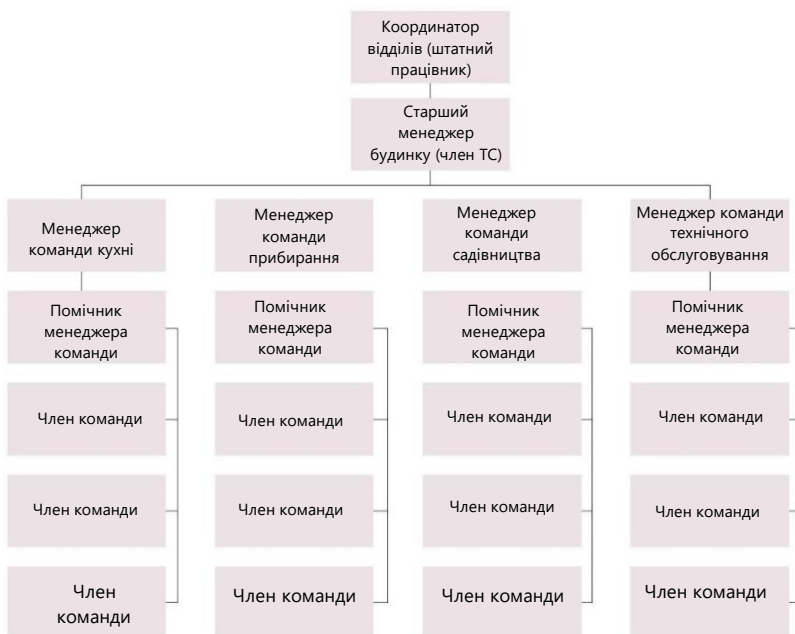
МАЛ. 3: Типова структура дому ТС

Структура забезпечує: стабільність у житті, яке часто було хаотичним; можливість націлюватися на короткострокові цілі; форум, на якому можна спостерігати за поганою поведінкою та ставленням і оскаржувати їх; можливість навчитися використовувати владу на благо громади; і форум, на якому можна перевірити особисті зміни в безпечному та сприятливому середовищі (1, 27) .