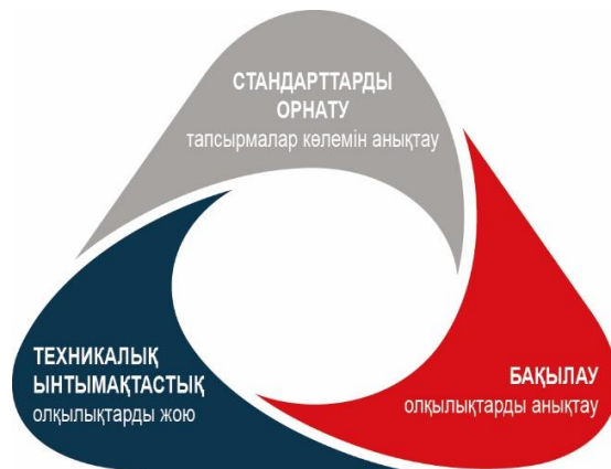
1-сурет: Еуропалық Кеңестің стратегиялық ұштағаны

Қазақстан Республикасы Еуропа Кеңесіне мүше мемлекет болмағандықтан, бұл ел тиісті конвенциялардың уағдаласушы тарапына айналмағанша, қадағалау тетіктері оған қолданылмайды. Атап айтқанда, ел Сыбайлас жемқорлыққа қарсы күрес жөніндегі мемлекеттер тобының (ГРЕКО) мүшесі болып табылады. 2021 жылғы 6-10 қыркүйекте ГРЕКО Қазақстанға алғашқы бағалау сапарымен келді. Бағалау туралы баяндама 2022 жылғы маусымда жарияланды. ГРЕКО Қазақстан Республикасының билік орындарына 2023 жылғы 30 қыркүйекке дейін ұсыныстамалардың орындалуы туралы баяндама жасауды ұсынды.