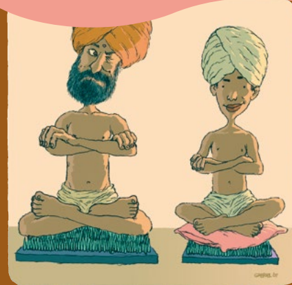
Les enfants ont besoin de plus de protection et non le contraire.