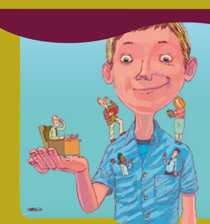
Les droits de l'enfant nous concernent tous.