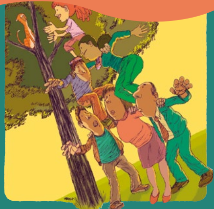
Les droits de l'enfant font grandir la famille.

La parentalité positive renvoie à un comportement parental qui respecte l'intérêt supérieur de l'enfant et ses droits, comme l'énonce la Convention des Nations Unies relative aux droits de l'enfant qui prend aussi en compte les besoins et les ressources des parents. Les parents qui agissent ainsi veillent au bien-être de l'enfant, favorisent son autonomie, le guident et le reconnaissent comme un individu à part entière. La parentalité positive n'est pas une parentalité permissive : elle fixe les limites dont l'enfant a besoin, de manière à l'aider à s'épanouir pleinement. La parentalité positive respecte les droits de l'enfant et favorise l'éducation dans un milieu non violent.