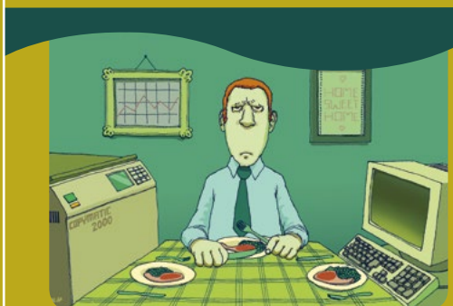
La parentalité positive signifie un équilibre entre vie familiale et vie professionnelle.