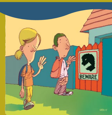
Les parents ont besoin d'aide pour gérer leur stress.