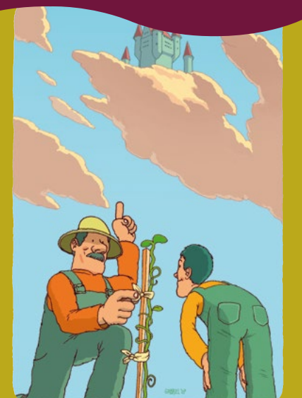
Les enfants ont besoin d'orientations de manière à s'épanouir pleinement.