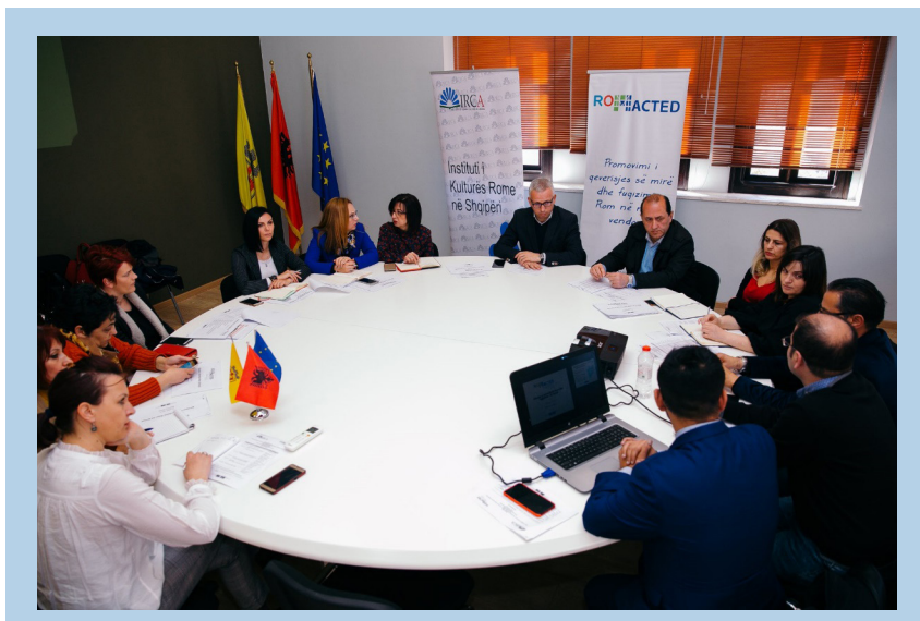
Figura 5. Pamje nga takimi me Grupin Institucional të Punës, Bashkia Korçë

Të dhëna parësore u mblodhën edhe nga Bashkia, veçanërisht në raport me kapacitetet e saj në funksion të planit për integrimin e romëve dhe egjiptianëve, përgjatë takimeve me grupin institucional (Shtojca 9.2).