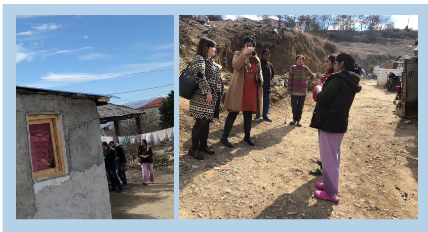
Figura 3. Pamje nga vizitat dhe vëzhgimet në terren (ish-gjeologjika)

Gjatë vizitave të shumta në zonat e synuara janë mbajtur takime në komunitet, në mjedise të mbyllura ashtu edhe në vendqëndrimet e R&E, në mjedise të hapura. Për një diskutim më të fokusuar dhe thelluar, si dhe për njohjen më të thellë dhe tërësore të problemeve dhe nevojave janë zbatuar edhe metodat e diskutimit në