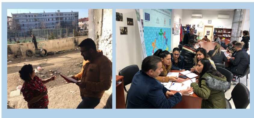
Figura 4. Pamje nga aktivitetet për mbledhjen e të dhënave paresore (intervista, fokus-grupe, ushtrime etj.)

fokus-grupe, është zbatuar “Hartëzimi i Burimeve”, “Pema e problemit” dhe “Matrica e Problemeve”, “Prioritizimi i Problemeve” (për më shumë shiko Shtojca 9.1).