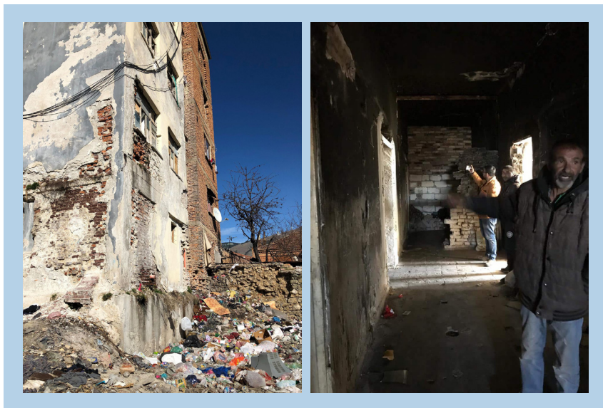
Figura 2. Pamje nga vizitat dhe vëzhgimet në terren (ish-konviktet)