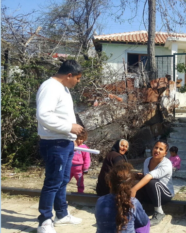
Figura 2. Intervistë (e pastrukturuar) me përfitues të programit të strehimit (rikonstruksion banese), Mbrostar

Gjatë vizitave të shumta në zonat e synuara janë mbajtur takime në komunitet, në mjedise të mbyllura ashtu edhe në vendqëndrimet e R&E, në mjedise të hapura.