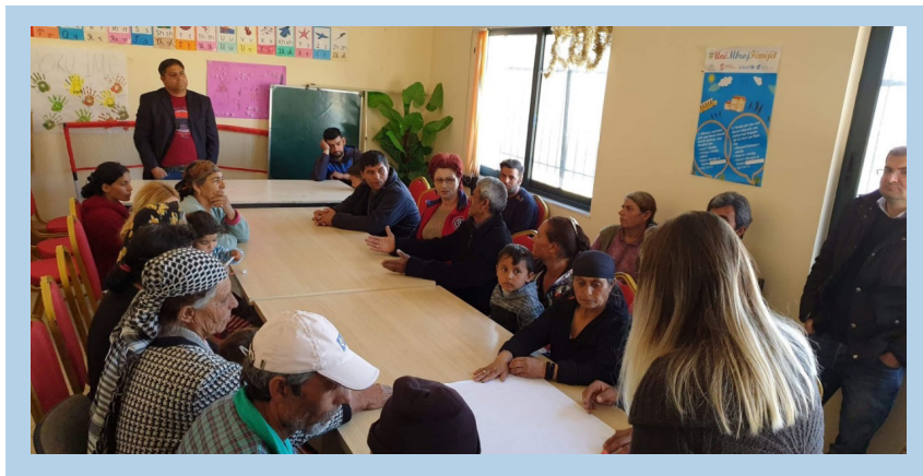
Figura 4. “Pema e Problemit”, Levan

Për një diskutim më të fokusuar dhe thelluar, si dhe për njohjen më të thellë dhe tërësore të problemeve dhe nevojave janë zbatuar edhe metodat e diskutimit në fokus-grupe, është zbatuar “Pema e problemit” dhe “Matrica e Problemeve”.