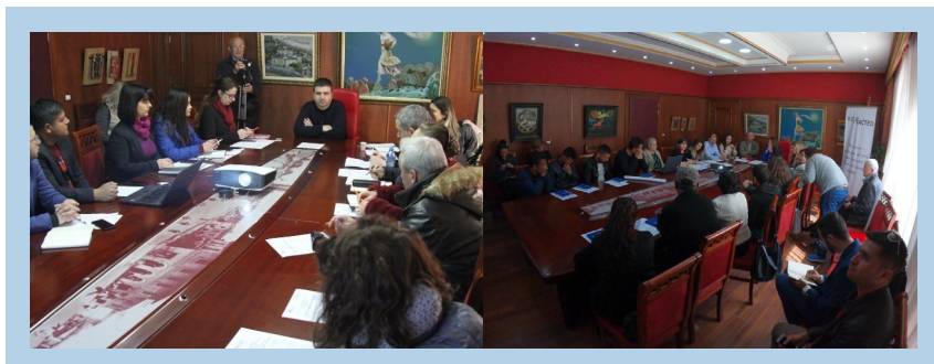
Figura 5. Pamje nga takimet me Grupin Institucional të Punës, Bashkia Fier.

Të dhëna parësore u mblodhën edhe nga Bashkia, veçanërisht në raport me kapacitetet e saj në funksion të planit për integrimin e pakicave rome dhe egjiptiane (Shtojca 9.2).