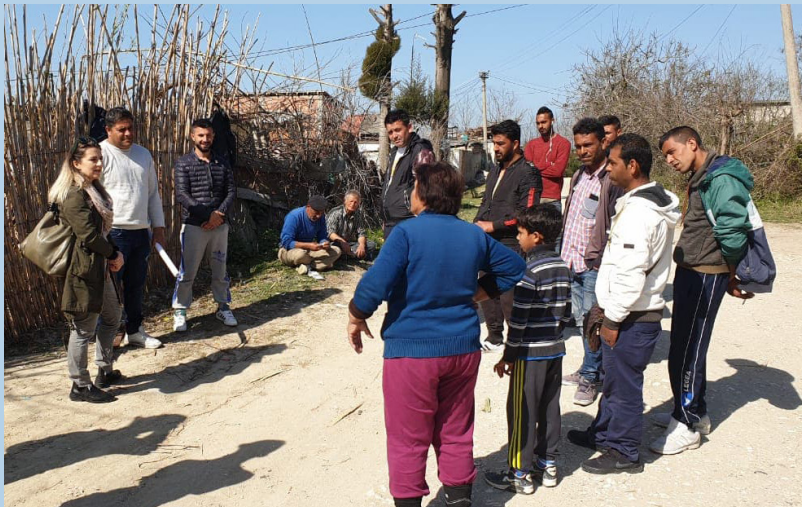
Figura 3. Diskutim në grup mbi prioritizimin e problematikave të identifikuara më herët nga lehtësuesit - Mbrostar

Gjatë vizitave të shumta në zonat e synuara janë mbajtur takime në komunitet, në mjedise të mbyllura ashtu edhe në vendqëndrimet e R&E, në mjedise të hapura.