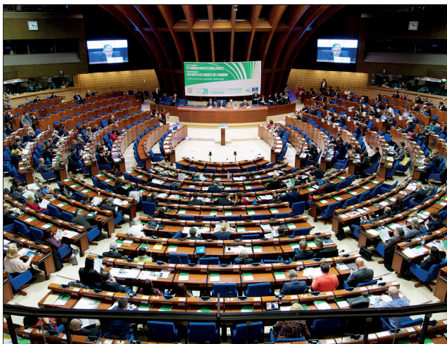
Доклады о мониторинге обсуждаются и принимаются на пленарных сессиях Конгресса.

Административный контроль за деятельностью органов местного самоуправления