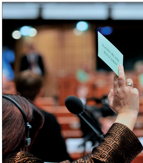
Свободная реализация выборными лицами своих полномочий обеспечивается также через систему голосования.

“[ ... ] Местные сообщества должны иметь возможность сами определять создаваемые для решения своих задач внутренние административные структуры, обеспечиваю-