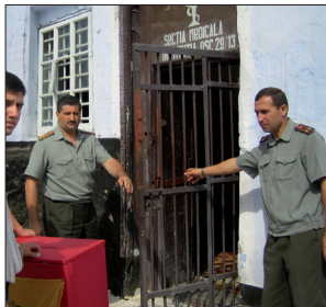
Урна для голосования в тюрьме в Кишиневе (Молдова). Соблюдение гражданских прав, даже в тюрьме, является показателем качества местной демократии в стране.

во время проведения мероприятий по мониторингу, а также рекомендаций Конгресса государства-члены осуществили целый ряд значительных реформ законодательства.