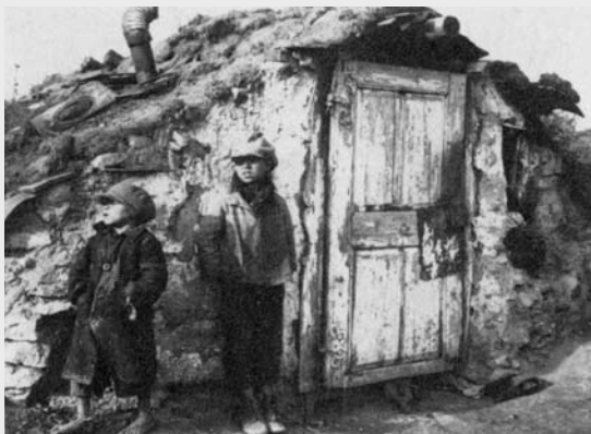
III. 2 (ur Mayerhofer 1988, s. 177)