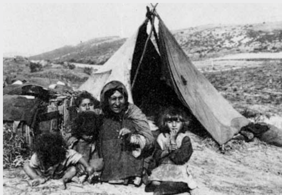
III. 5 (ur Mayerhofer 1988, s. 184)