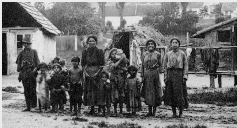
III. 4 (ur Mayerhofer 1988, s. 184)