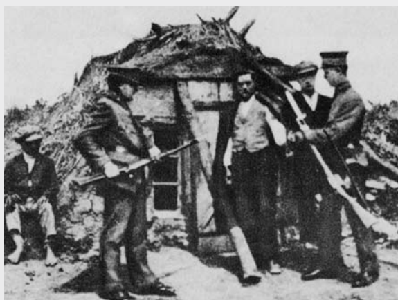
III. 6 (ur Mayerhofer 1988, s. 178)

III. 5 En internerad hantverkares familj framför tältet, mellan krigen.