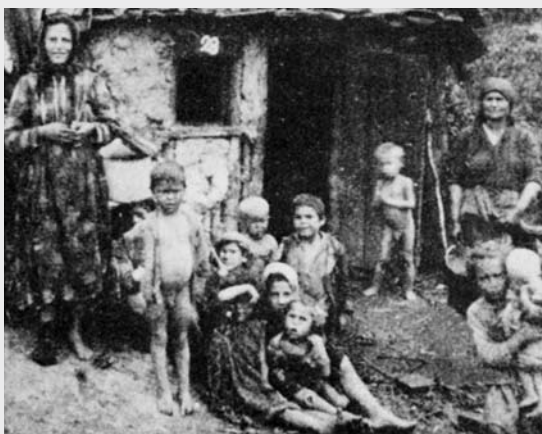
III. 3 (ur Mayerhofer 1988, s. 37)

En bosättning i Mattersburg, Burgenland mellan krigen. Bilden visar de tre olika typer av boende som fanns under perioden. till vänster, ett putsat och kalkfärgat hus av lertegel, i mitten en "putri", en koja halvt nergrävd i jorden, till hälften gjord av trä, grenar och lera, och till höger en lertätad, halvt timrad byggnad.