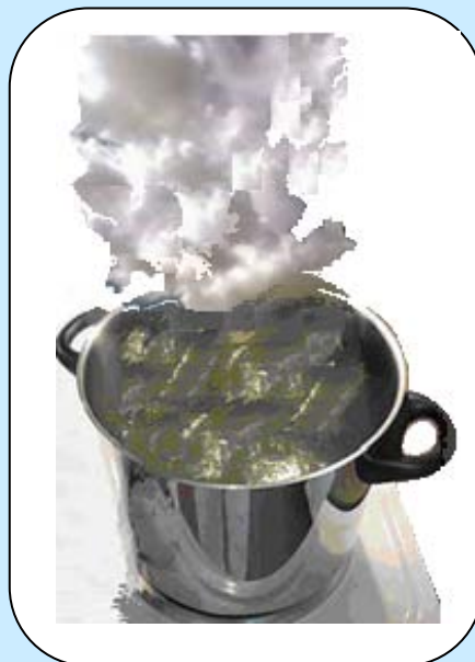
O kerado paj