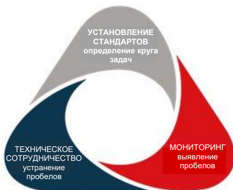
Рис. 1: Стратегический треугольник Совета Европы

Программы Совета Европы по оказанию технической помощи являются неотъемлемой частью уникального стратегического треугольника, который основан на установлении стандартов, мониторинге и сотрудничестве. После разработки стандартов, имеющих обязательную юридическую силу, наступает этап мониторинга их выполнения посредством независимых механизмов, который дополняется техническим сотрудничеством в поддержку их осуществления. Совет Европы разрабатывает и ведет деятельность в тех областях, в которых Организация обладает существенным опытом и знаниями, и в которые она вносит значительный вклад.