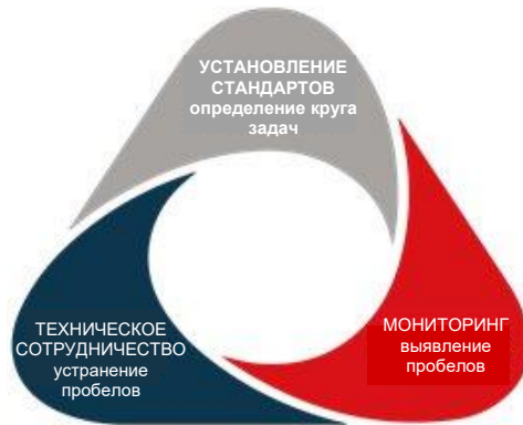
Рис. 1: Стратегический треугольник Совета Европы

Программы Совета Европы по оказанию технической помощи являются неотъемлемой частью уникального стратегического треугольника, который основан на установлении стандартов, мониторинге и сотрудничестве. После разработки стандартов, имеющих обязательную юридическую силу, наступает этап мониторинга их выполнения посредством независимых механизмов, который дополняется техническим сотрудничеством в поддержку их осуществления. Совет Европы разрабатывает и ведет деятельность в тех областях, в которых Организация обладает существенным опытом и знаниями, и в которые она вносит значительный вклад.