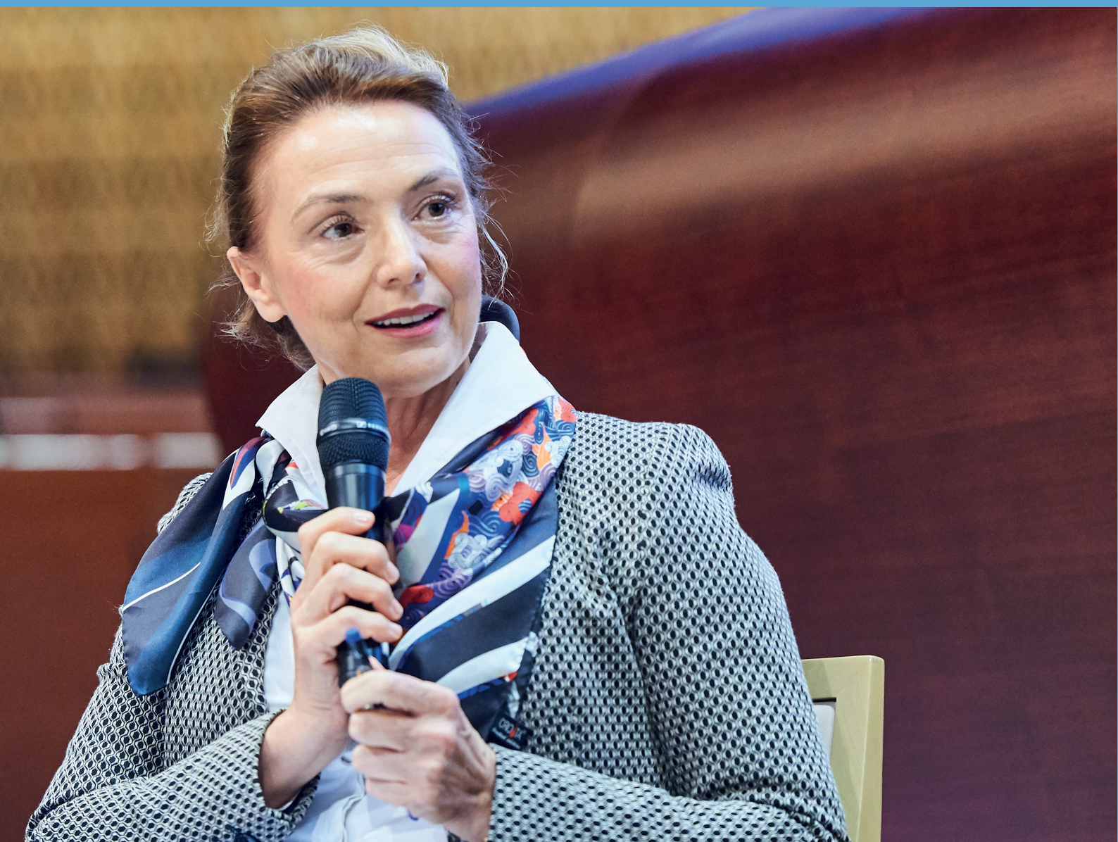
Marija Pejčinović Burić Secrétaire Générale du Conseil de l'Europe