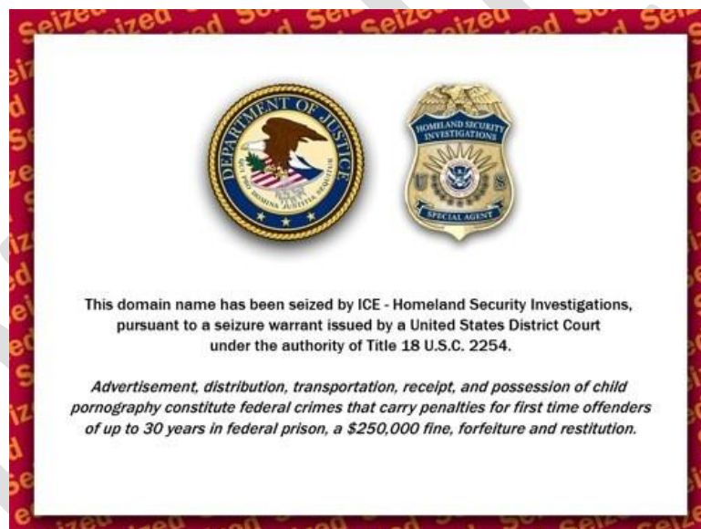
Figure 2 Image présentée aux visiteurs de dizaines de milliers de sites web entièrement légitimes hébergés sur moo.com, suite à la saisie du domaine par les autorités policières américaines.

À titre d'exemple des problèmes à éviter, l'expérience des utilisateurs du service d'hébergement web moo.com mérite d'être soulignée. Moo.com était un service d'hébergement de sites web, où chaque site hébergé constituait un sous-domaine du nom de domaine du service (hostedsite.moo.com, par exemple). Un petit nombre de ces sites hébergés ont été découverts comme contenant du matériel illégal. 113 Au lieu de saisir le petit nombre de sites contenant du matériel illégal, les autorités américaines ont saisi la totalité du domaine moo.com et ont remplacé tout ce qu'il hébergeait par l'image ci-dessous. En conséquence, les visiteurs de l'un des 84 000 sites web légaux hébergés sur le service ont vu l'image, même si le site qu'ils visitaient n'avait jamais contenu de matériel illégal.