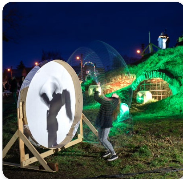
Šančiai Community Opera 2019, © ŽŠb

La partecipazione dei cittadini al patrimonio culturale regola le attività dell'Associazione comunitaria Šančiai a Kaunas (Lituania). La sua iniziativa CABBAGE FIELDS è un contributo alla partecipazione locale alla governance e alla rivitalizzazione di un sito storico abbandonato (un appezzamento di terreno pubblico che ospita tre strutture in mattoni del XIX secolo situate nell'ex caserma militare), con l'obiettivo di riappropriarsi della sua identità culturale.