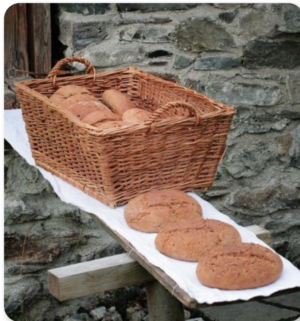
L'iniziativa BrotZeit

BROTZEIT ("tempo del pane") si concentra sulla sostenibilità culturale e sulle molteplici pratiche agricole e manuali di coltivazione, lavorazione del grano e produzione di pane tradizionale nella Valle di Lesach (Austria).