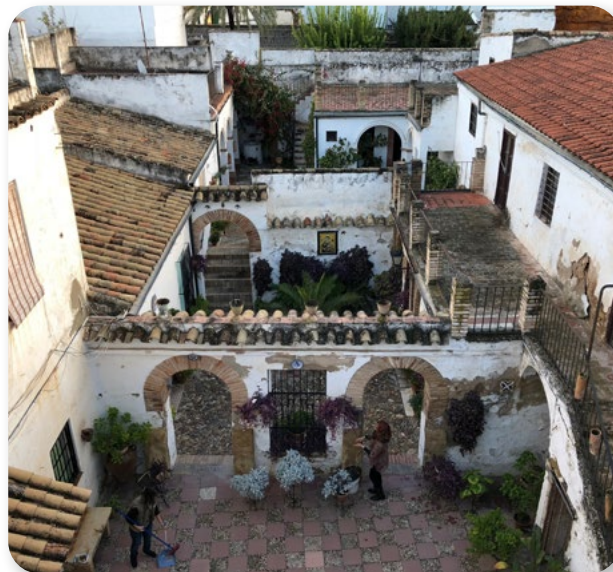
Patios di Córdoba

PAX PATIOS DE LA AXERQUÍA sta affrontando la questione del turismo eccessivo che colpisce la città di Córdoba (Spagna) e che sta causando il decadimento e la riconversione delle sue tradizionali comunità abitative (cortili) in oggetti turistici.