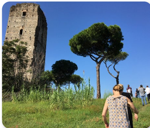
Parco Centocelle Heritage co-district

Il Parco archeologico di Centocelle a Roma (Italia) è stato aperto al pubblico nel 2006, a seguito di scavi archeologici. Sebbene si trovi di fronte a occupazioni illecite, che esistono ancora in parte, il Parco ha iniziato ad attirare l'interesse del pubblico in generale, a seguito dell'intenso lavoro della comunità locale, basato sulla valorizzazione del suo capitale sociale.