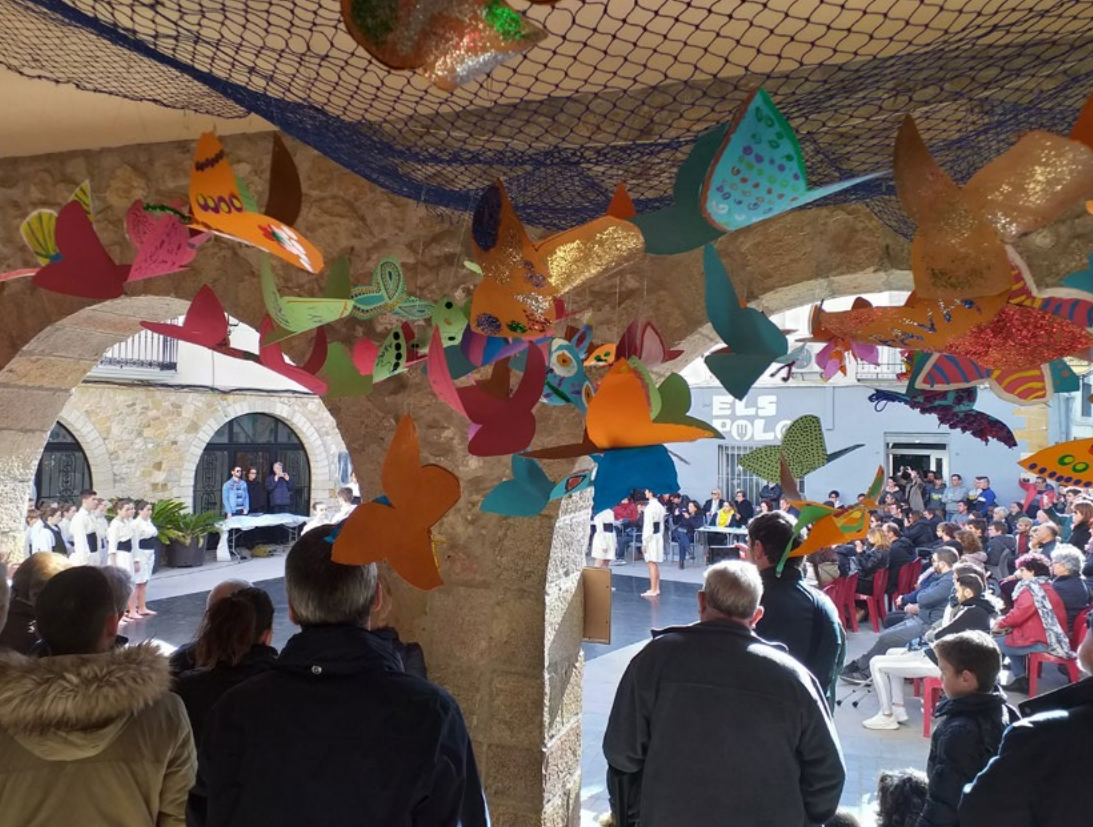
Vilanova d'Alcolea Festival delle Arti