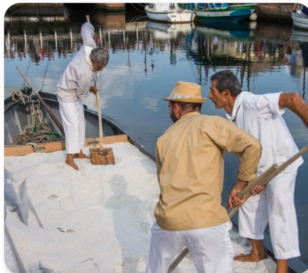
Ecomuseo del Sale e del Mare

L'ECOMUSEO DEL SALE E DEL MARE , Cervia (Italia) è un'iniziativa volta a preservare e valorizzare il paesaggio naturale e urbano di questo sito, la cultura e la memoria locali. È un'opportunità per i visitatori e la popolazione locale di conoscere un territorio in continua evoluzione, un museo in tutta la città, nonché un modo per contribuire alla conservazione del sito e all'ulteriore sviluppo della comunità.