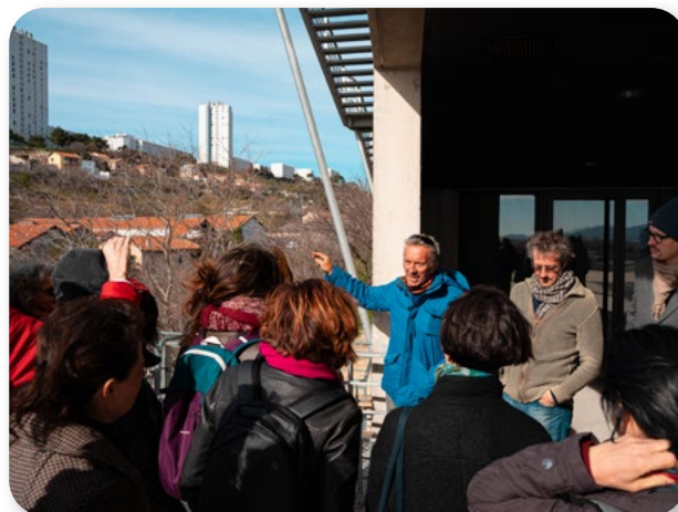
Passeggiata patrimoniale a Marsiglia

HÔTEL DU NORD è un progetto costituito da alcune iniziative su piccola scala che creano opportunità per gli attori locali di lavorare insieme e migliorare le cattive condizioni di vita, la discriminazione e la povertà che colpiscono alcuni quartieri di Marsiglia (Francia).