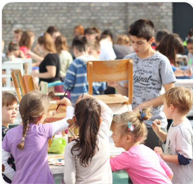
Laboratorio di pittura, Novi Sad