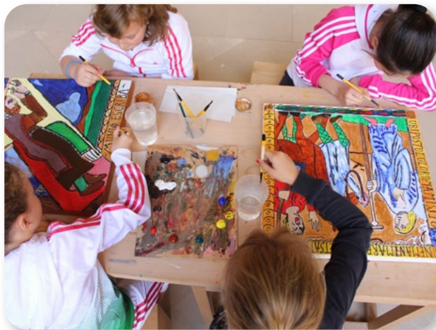
Ai Monasteri di La Rioja