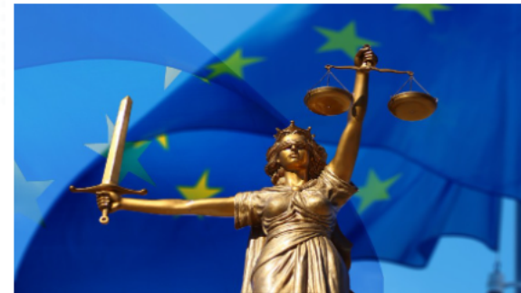
International case law

If you came across an interesting case law (either at international level, or at national level), you are more than welcome to share it with us!