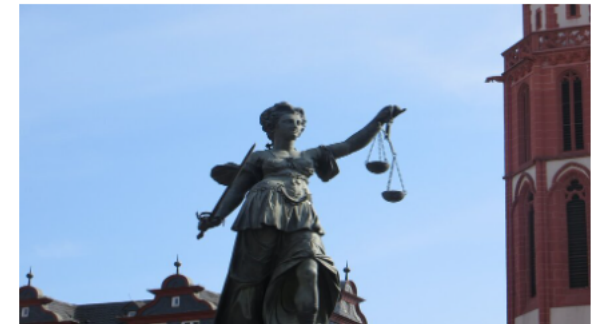
Domestic case law