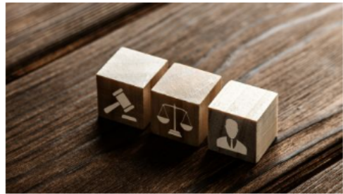
Domestic legislation on cyberviolence

This section presents information on domestic legislation and policies, as well as binding and soft law instruments at the international level.