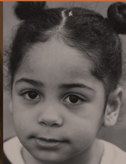
ՔԱՂԱՔԱԿԱՆՈՒ- ԹՅՈՒՆՆԵՐԻ ՀԱՄԱԿԱՐԳՈՒՄ