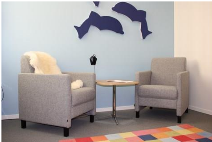
გამოკითხვის ოთახი ბარნაჰუსში, ტრომსო, ნორვეგია.