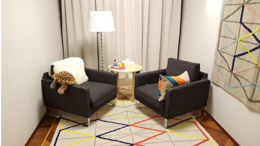
გამოკითხვის ოთახი ბარნაჰუსში, ისლანდია.