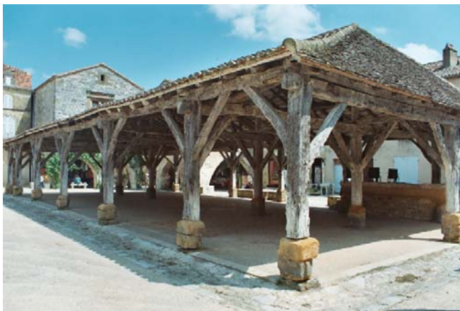
Les libertés du marché n'ont de sens que liées par la charpente démocratique aux autres libertés.

Après ses colloques consacrés à la corruption, puis à la responsabilité commune dans l'activité économique, l'IIEDH a créé un groupe Ecoéthique, associant des partenaires privés, publics et civils ainsi que d'autres universités, dans le but de réaliser un Think tank , ou « laboratoire d'idées et de pratiques » approprié: lieu de partage et d'accumulation des expériences, observations et analyses, dans le respect des spécificités et objectifs de chaque acteur. Outre l'étude de ces partenariats, l'IIEDH continue sa recherche sur plusieurs droits économiques et sociaux, notamment le droit à l'alimentation, en partenariat avec l'Institut J. Maritain, à Rome (colloque en septembre 2001, à Rome, dans le cadre de la préparation du Sommet de la FAO).