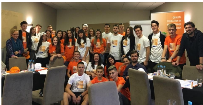
Fokus grupe sa učenicima, 29-30.09.2018. Jahorina, 34 učenika iz 8 pilot škola

Ovaj proces konsultacija također je ukazao i na buduću orijentaciju u razmišljanju učenika koja bi se mogla sumirati u rečenici jednog učenika: „ Želimo živjeti svoju budućnost, a ne njihovu prošlost. “