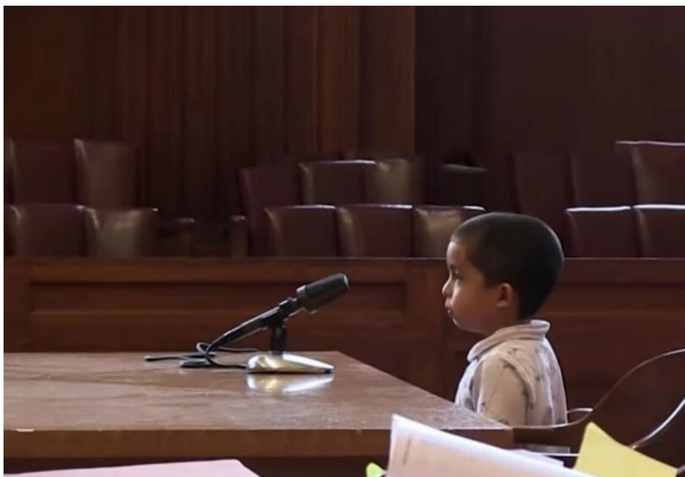
Dijete svjedok daje izjavu pred praznim sudom

Iako se pojam „dijete“ u velikoj mjeri upotrebljava u nacionalnom zakonodavstvu, trenutno ne postoji jedinstvena pravna definicija „djeteta“ u Bosni i Hercegovini. U nekim kontekstima se u krivičnim zakonima, zakonima o zaštiti djece, porodičnim zakonima, zakonima o radu i drugim zakonima dijete navodi kao osoba koja još nije navršila 18 godina. Međutim, u nekim zakonima nije definiran pojam „dijete“, a neki krivični zakoni razlikuju „dijete“ i „maloljetnika“. Definicija „djeteta“ i zakonske dobne granice razlikuju se ne samo među sektorskim zakonima nego i između zakonodavstva na državnom i nižim nivoima.