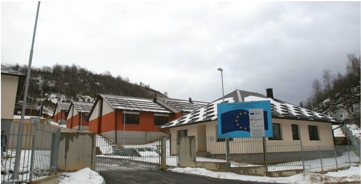
Prihvatni centar „Delijaš“

Iako u Bosni i Hercegovini postoje specijalizirani centri za smještaj i usluge prihvata za djecu bez pratnje, nije zagarantirano da se djeca upućuju na te usluge. Djeca bez pratnje smještaju se ne samo u prihvatne centre, već i u imigracijske centre za zadržavanje i smještaj za porodice. Prihvatnim centrima upravljaju državne agencije ili međunarodne organizacije ili u okviru javno-privatnog partnerstva međunarodnih i nacionalnih organizacija s državnim agencijama (vidi Okvir 2.).