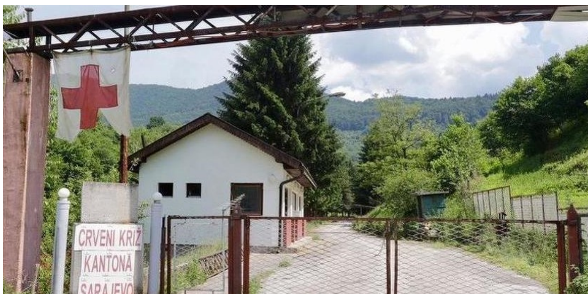
Privremeni prihvatni centar Ušivak u općini Hadžići, Fotografija: D.S. / klix.ba

U Kantonu Sarajevo migranti i izbjeglice obavljaju inicijalni razgovor sa terenskim službenikom Službe za poslove sa strancima. Migranti i izbjeglice koji se smatraju djecom bez pratnje upućuju se u Privremeni prihvatni centar „Ušivak“ u općini Hadžići gdje prolaze medicinski pregled i dobijaju medicinsku pomoć i druge usluge u skladu sa njihovim trenutnim potrebama. Stručnjaci Službe za poslove sa strancima identificiraju djecu čija je dob nejasna i upućuju ih na socijalni intervju radi procjene dobi.