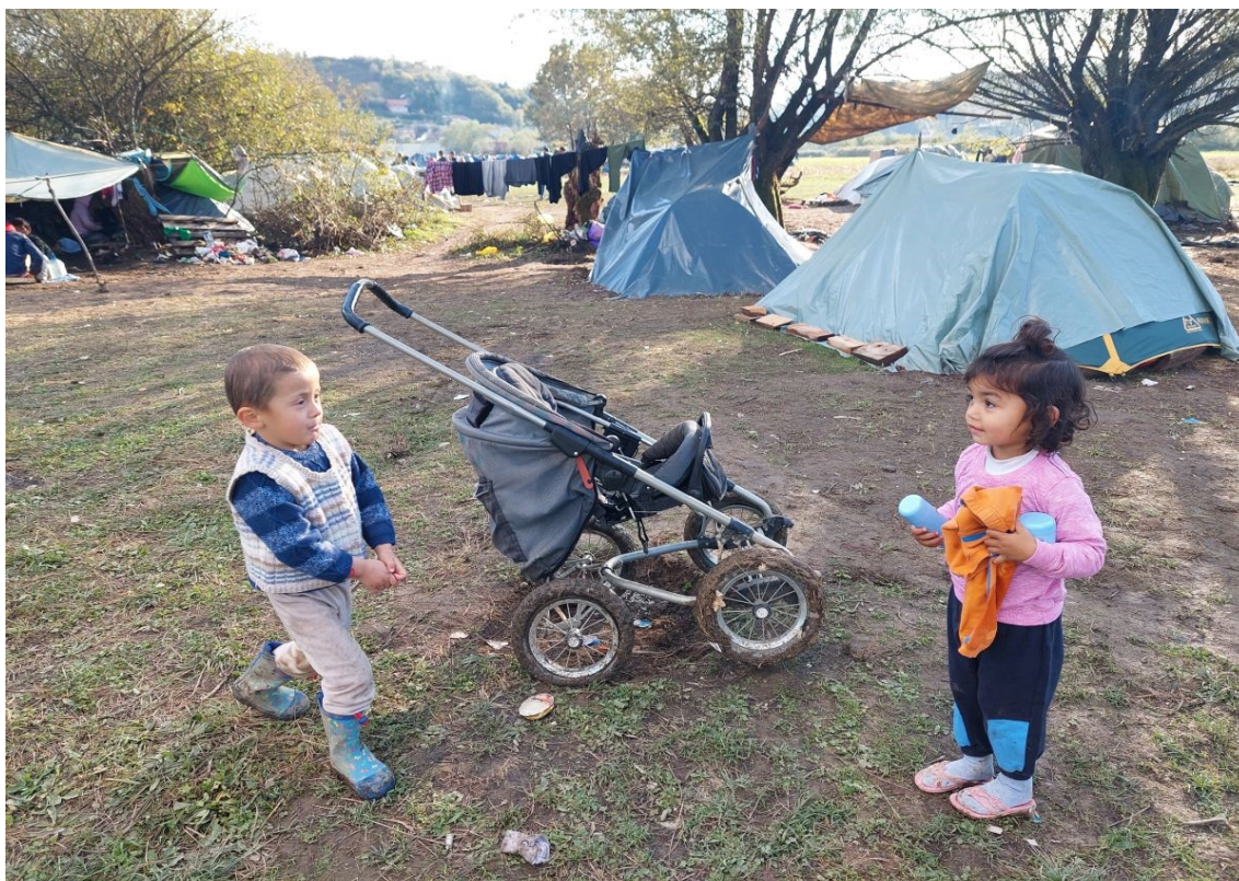
Afganistanske izbjeglice u Velikoj Kladaši, Bosna i Hercegovina

Podržati razmjenu iskustava, naučenih lekcija i dokaza o upotrebi intervjua za procjenu dobi u različitim evropskim zemljama , na primjer putem međunarodne konferencije ili savjetovanja, s ciljem utvrđivanja ključnih naučenih lekcija na kojima bi se mogao zasnivati postupak izrade i distribucije informacija u Bosni i Hercegovini, regiji jugoistočne Evrope te državama članicama Evropske unije i Vijeću Evrope u širem smislu.