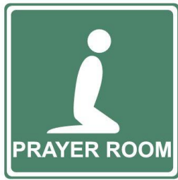
sala de oración