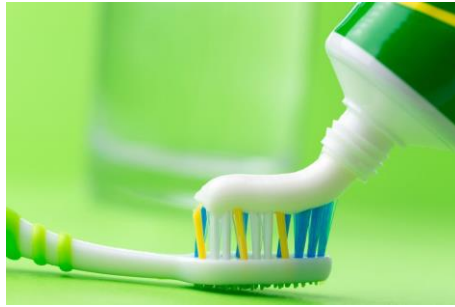
cepillo de dientes/pasta de dientes