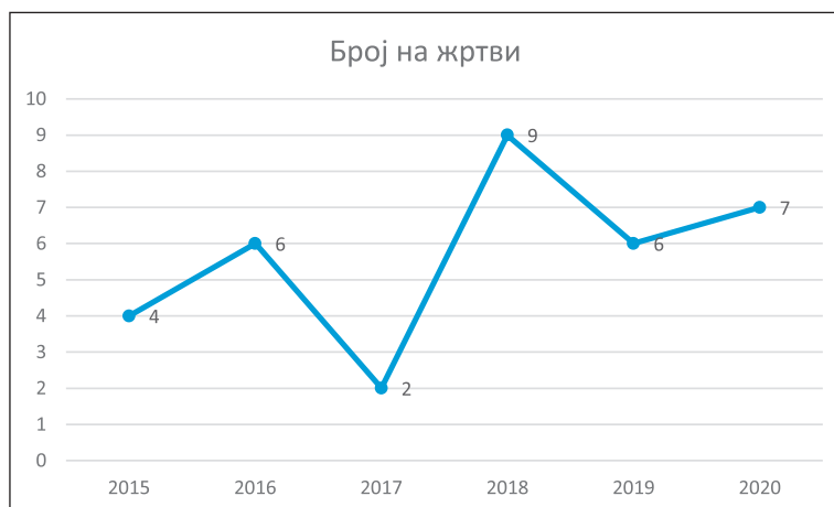
Слика 2: Број на жртви на трговијата со луѓе во Северна Македонија, 2015-2020

Според податоците од извештајот на ГРЕТА 2 за жртвите на ТЛ во 47 земји на Советот на Европа, бројот на жртвите на ТЛ се зголемил за 44% од 2015 до 2018 година, односно 10.598 жртви се идентификувани во 2015 г., а 15.310 се идентификувани во 2018 г.