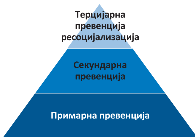
Слика 4: Видови превенција

Особено значајно е првото ниво – примарната превенција – што подразбира активности за спречување на појавата на трговија со деца.