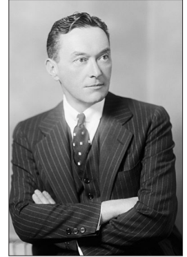
Uolter Lippman (1889–1974)

Amerika kommunikativisti, yazıçı, siyasi icmalçı Harvard məzunu olan Uolter Lippman akademik karyeradan imtina edərək siyasi icmalçılığı seçir. O, 1911-ci ildə T.Ruzveltin seçki kampaniyasında iştirak edir, 1916-cı ildə isə V.Vilsonun seçki kampaniyasının üzvü olur. 29 yaşında Paris Sülh Konfransına nümayəndə kimi qatılan U.Lippman Millətlər Liqasının yaranması haqqında konvensiyanın həmmüəllifidir. İlk sanballı əsəri – "Siyasətə giriş" 1913-cü ildə işiq üzü görüb. Bir çox Amerika prezidentinin qeyri-rəsmi müşaviri olub. Stereotip termini və Soyuq müharibə konsepsiyası ona məxsusdur. Amerikalılar onu XX əsrin ən nüfuzlu jurnalisti hesab edirlər.