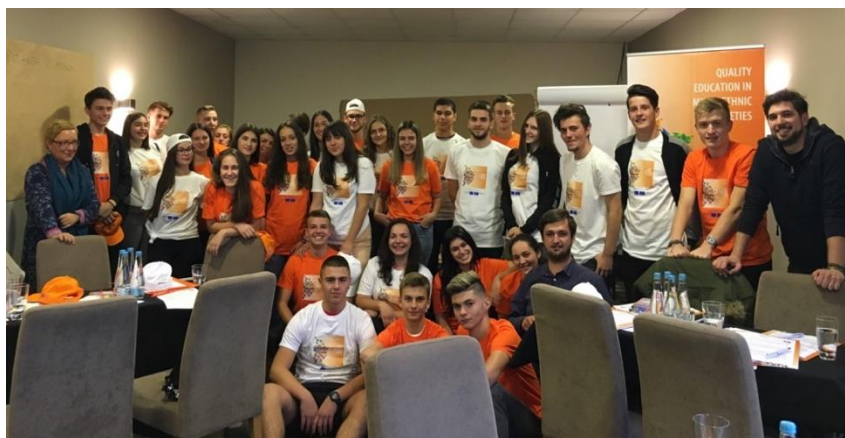
Fokus grupe sa učenicima, 29-30.09.2018. Jahorina, 34 učenika iz 8 pilot škola

Ovaj proces konsultacija također je ukazao i na buduću orijentaciju u razmišljanju učenika koja bi se mogla sumirati u rečenici jednog učenika: „ Želimo živjeti svoju budućnost, a ne njihovu prošlost. “