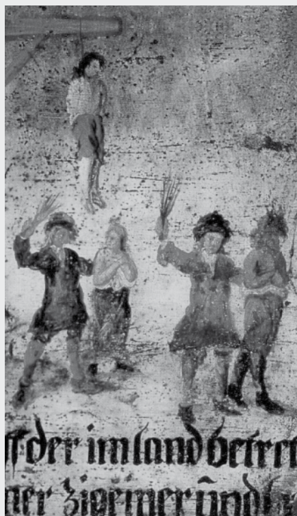
III. 5 (Detaj) Njoftimi paralajmërues për t'i kërcënuar romët, sikurse ishte shpallur në kufijtë e Perandorisë së Shenjtë Romake, c. 1715. (nga Asséo, Henriette 1994: Les Tsiganes. Une destinée européenne. Paris: Gallimard, p. 37)