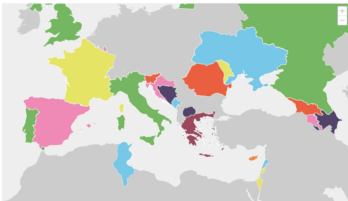
Fig. 1. Carte de l'itinéraire Iter Vitis

Elle compte actuellement 26 membres issus de 22 pays (2 membres de la Fédération de Russie ont été suspendus de toute activité conformément à la Résolution du Conseil de l'Europe). Le Conseil d'administration de la Fédération Iter Vitis est composé de 9 représentants de 8 pays, ce qui témoigne d'un modèle de gouvernance démocratique. Ce modèle est encore renforcé par la tenue de la Réunion générale annuelle (RGA), qui renforce la transparence et la prise de décision participative dans le cadre de l'itinéraire culturel Iter Vitis.