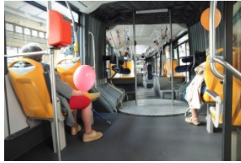
mit dem Bus, mit der Straßenbahn oder U-Bahn