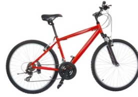
mit dem Fahrrad