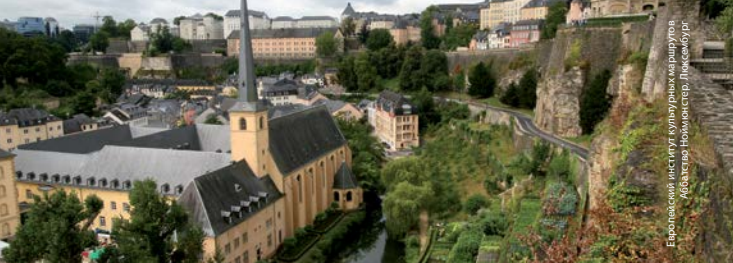
Европейский институт культурных маршрутов Аббатство Ноймюнстер, Люксембург