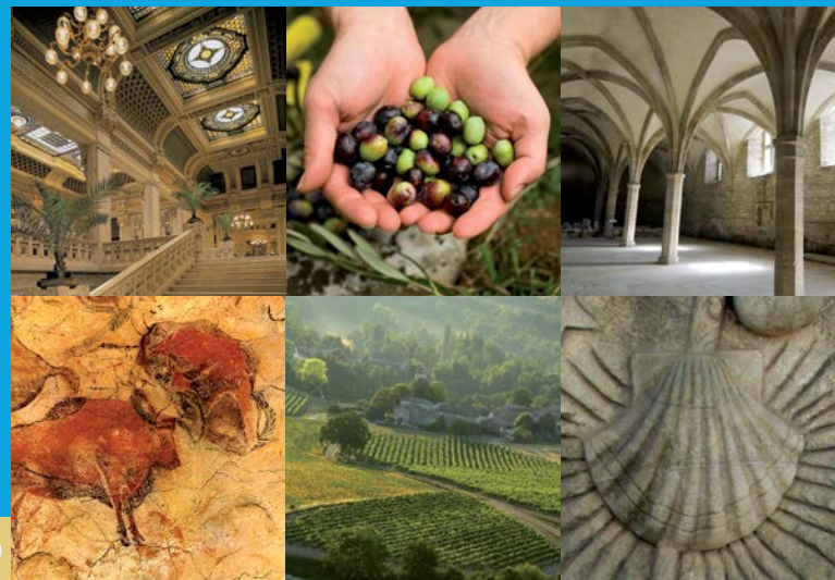
JUNE 2019

ევროპის საბჭო არის ადამიანის უფლებათა დაცვის წამყვანი ორგანიზაცია. მასში გაწევრიანებულია 47 ქვეყანა, რომელთაგან 28 ევროკავშირის წევრია. ევროპის საბჭოს ყველა წევრმა სახელმწიფომ ხელი მოაწერა ადამიანის უფლებათა ევროპული კონვენციას, რომელიც შეიქმნა ადამიანის უფლებების, დემოკრატიისა და კანონის უზენაესობის დაცვის მიზნით. ადამიანის უფლებათა ევროპული სასამართლო ზედამხედველობს წევრი სახელმწიფოების მიერ კონვენციის განხორციელებას.