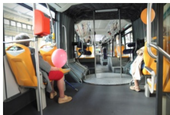
en bus, tram, métro