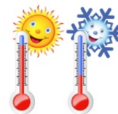
chaud / froid