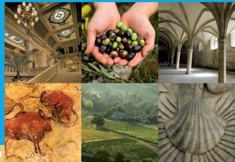
JUNE 2019

Eiropas Padome ir kontinenta vadošā cilvēktiesību organizācija. Tā apvieno 47 dalībvalstis, no kurām 28 ir Eiropas Savienības dalībvalstis. Visas Eiropas Padomes dalībvalstis ir parakstījušas Eiropas Cilvēktiesību konvenciju - līgumu, kas izstrādāts, lai aizsargātu cilvēktiesības, demokrātiju un tiesiskumu. Eiropas Cilvēktiesību tiesa pārrauga konvencijas īstenošanu dalībvalstīs.