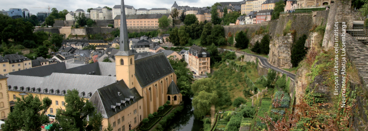
Eiropas Kultūras ceļu institūts Neumünster Abatija, Luksemburģa