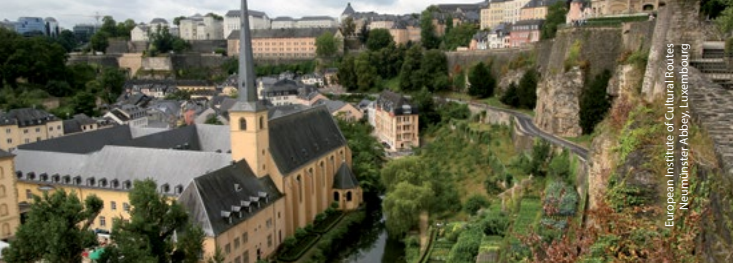
European Institute of Cultural Routes Neumünster Abbey, Luxembourg