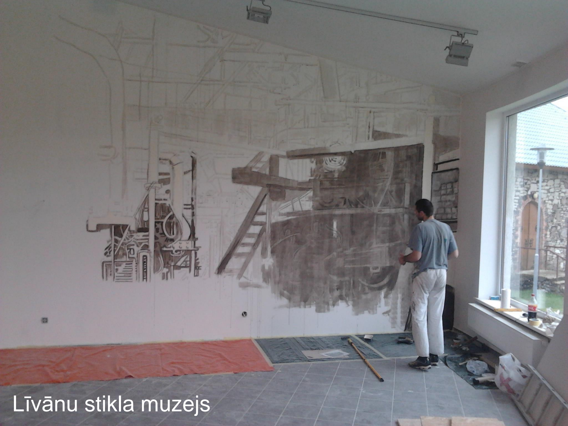
Līvānu stikla muzejs