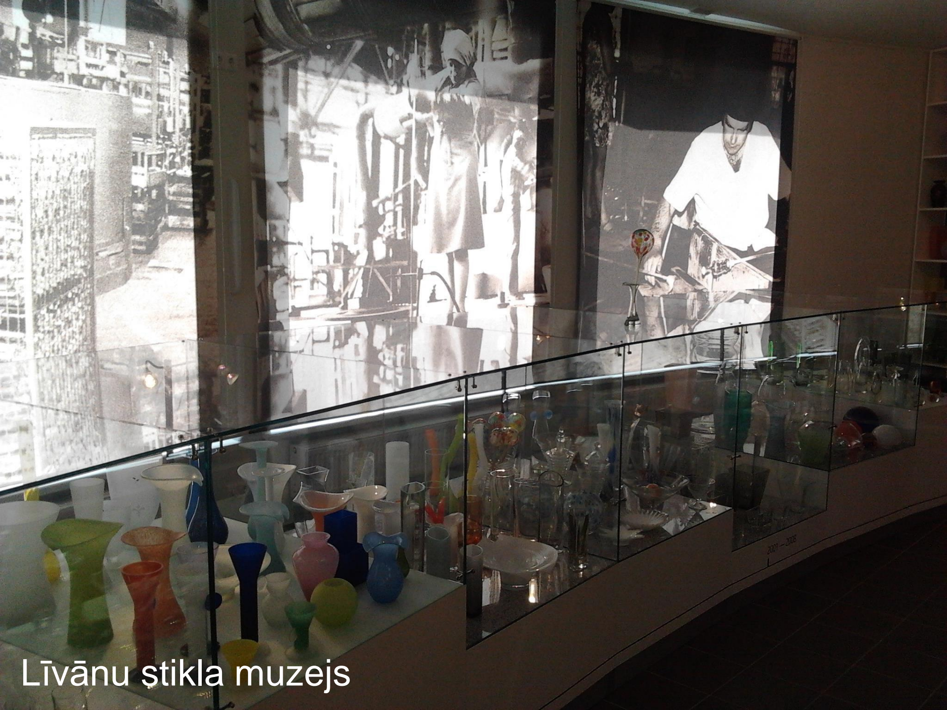
Līvānu štikla muzejs