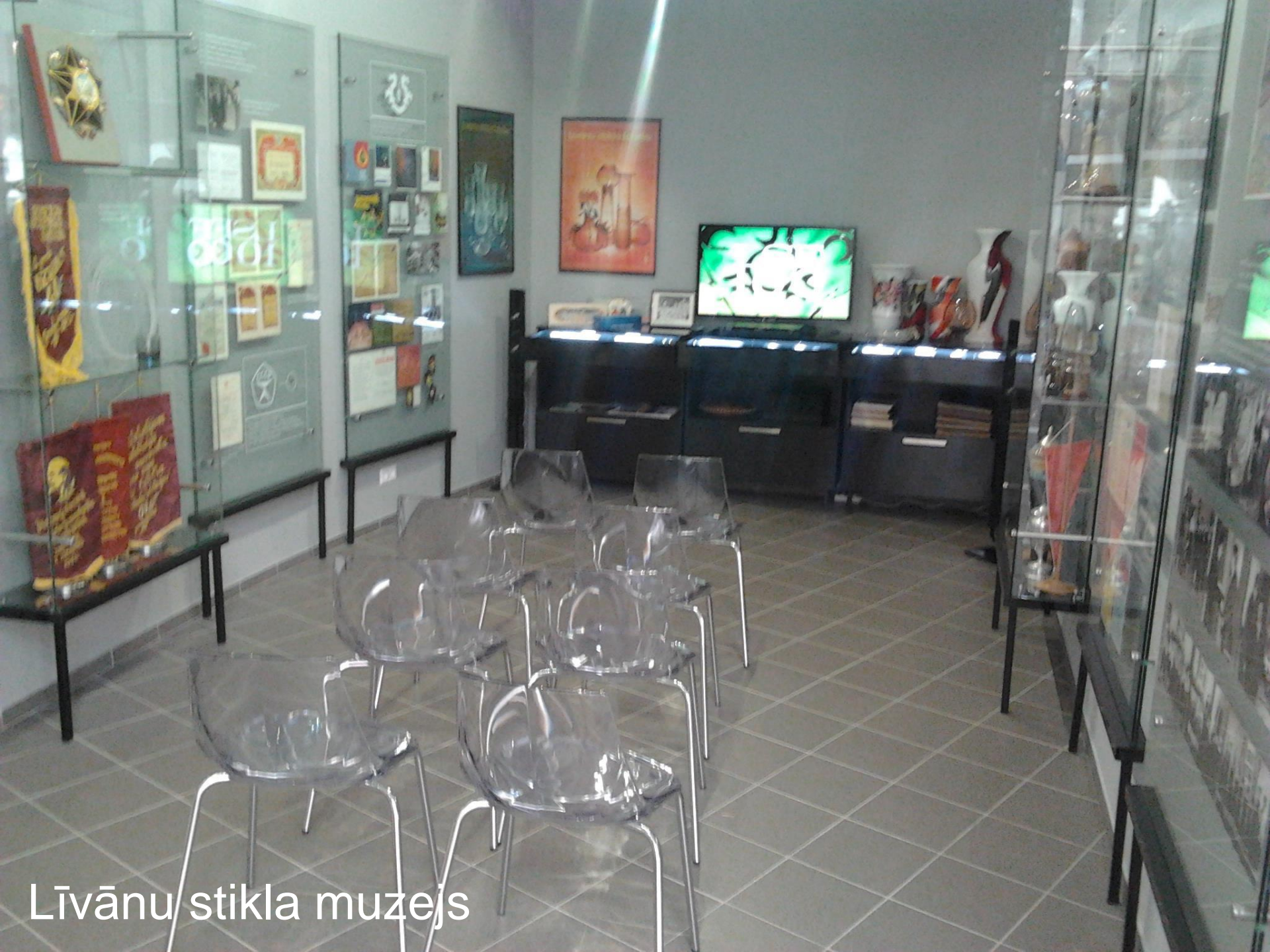
Līvānu stikla muzejs