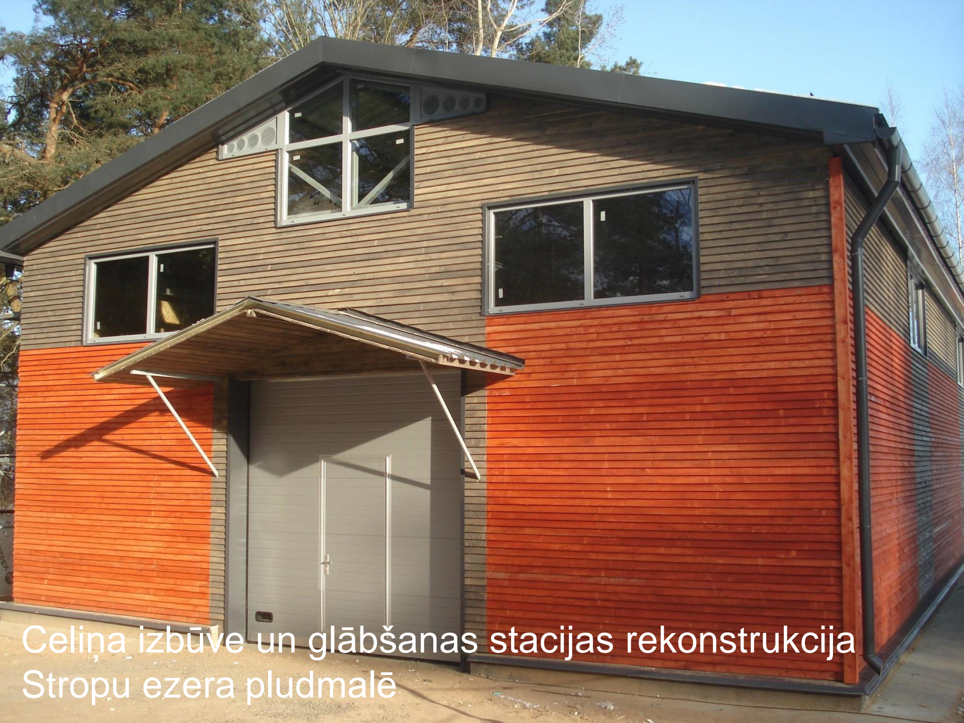
Celiņa izbūve un glābšanas stacijas rekonstrukcija Stropu ezera pludmalē