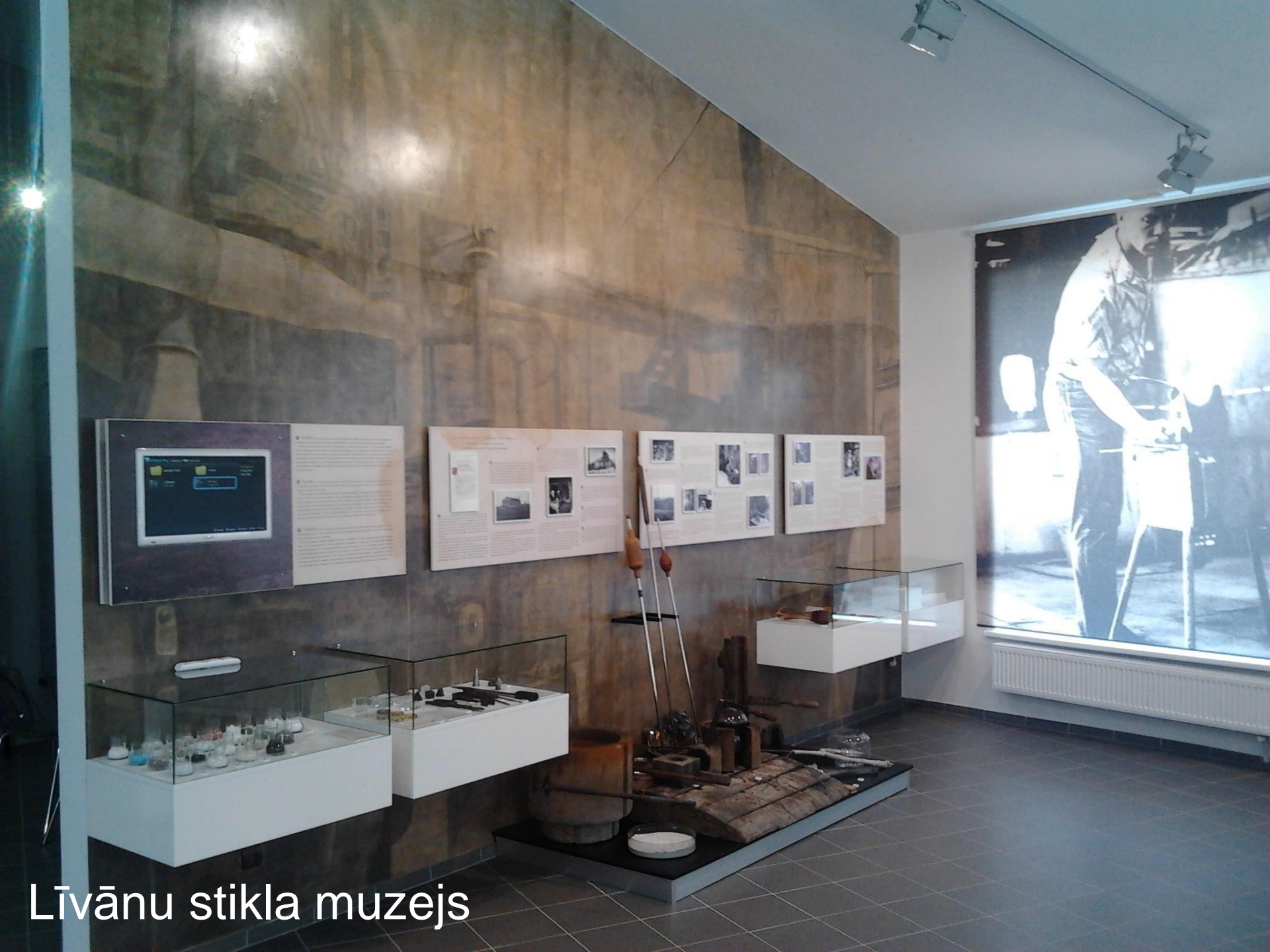
Līvānu stikla muzejs