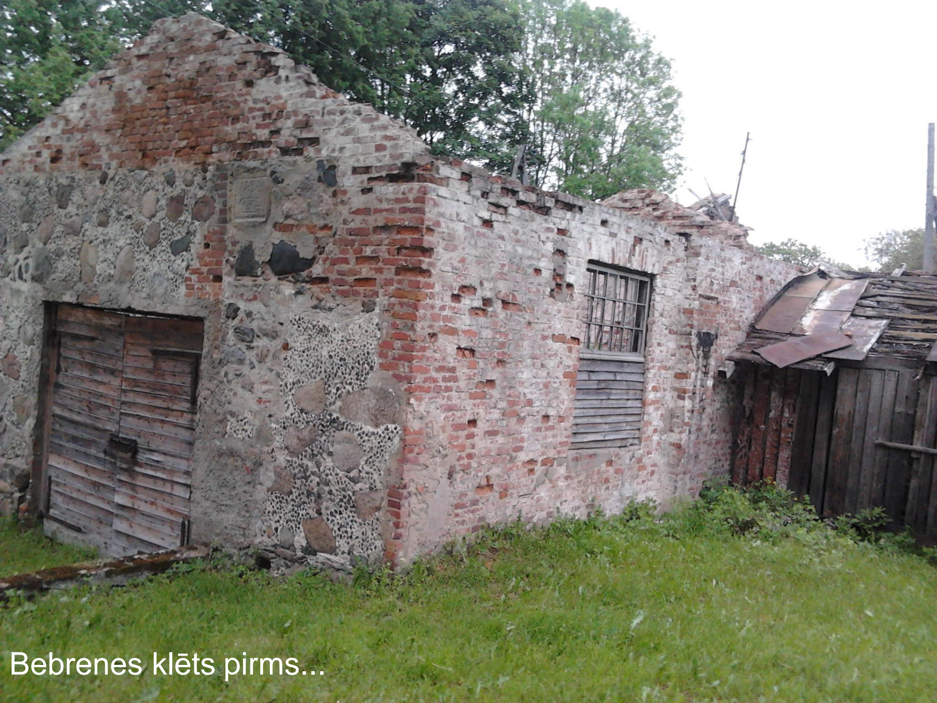
Bebrenes klēts pirms...