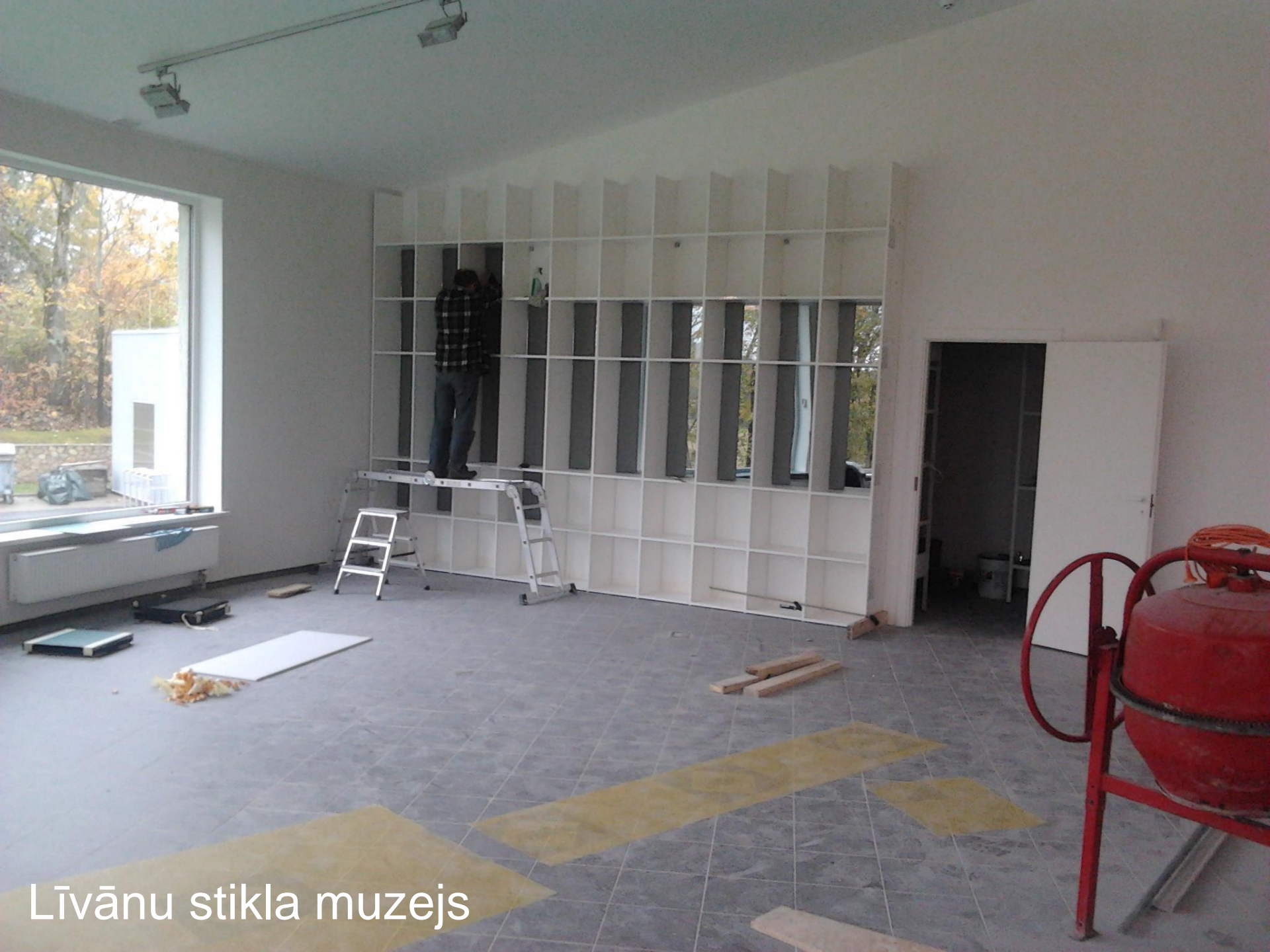
Līvānu stikla muzejs