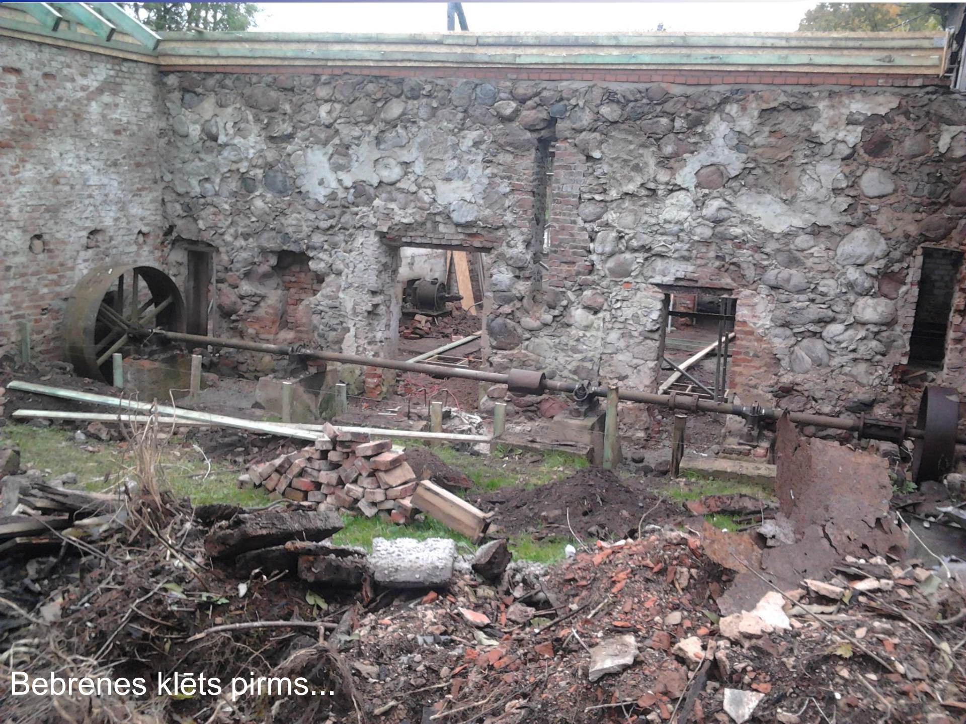
Bebrenes klēts pirms...