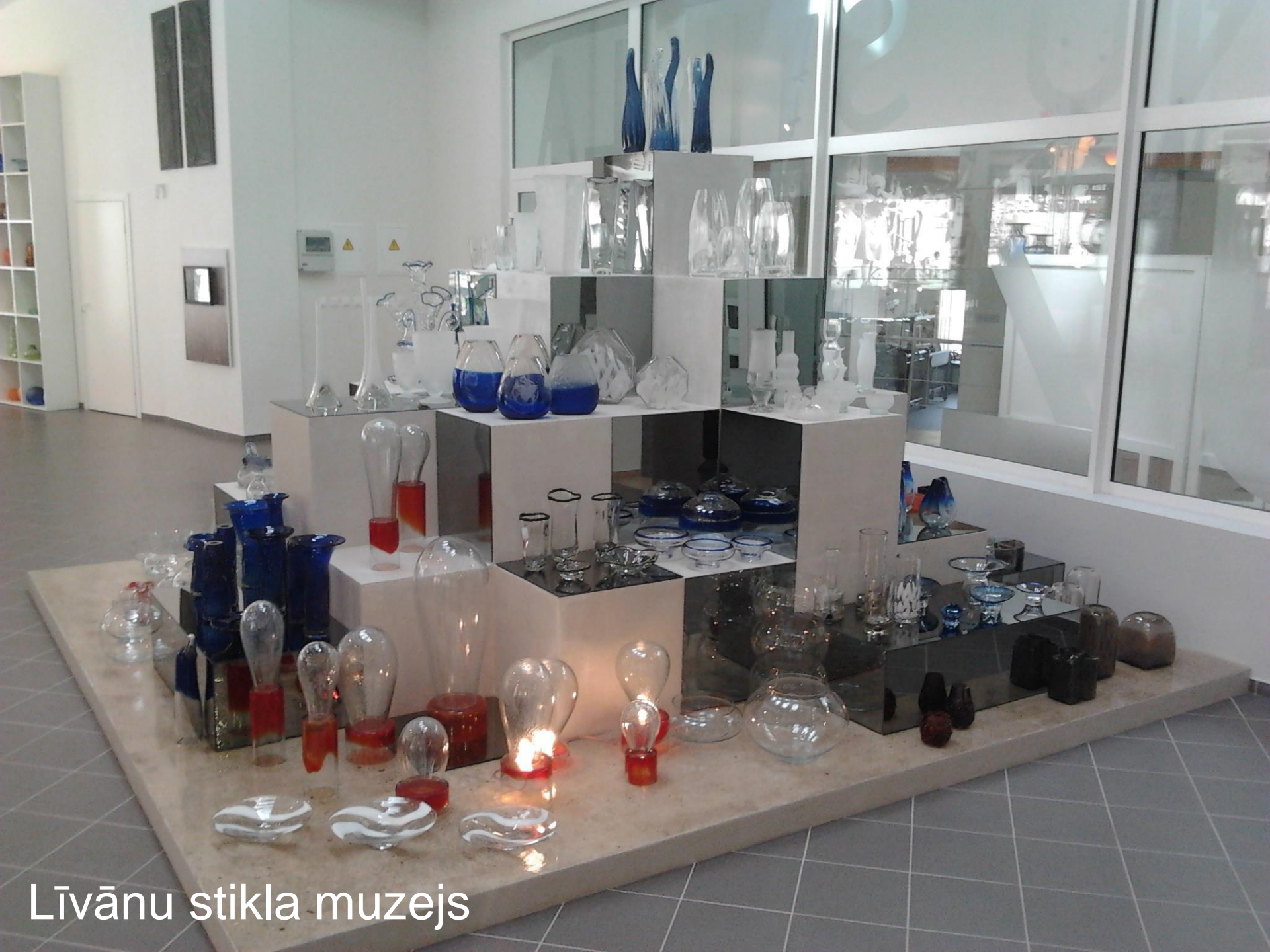
Līvānu stikla muzejs