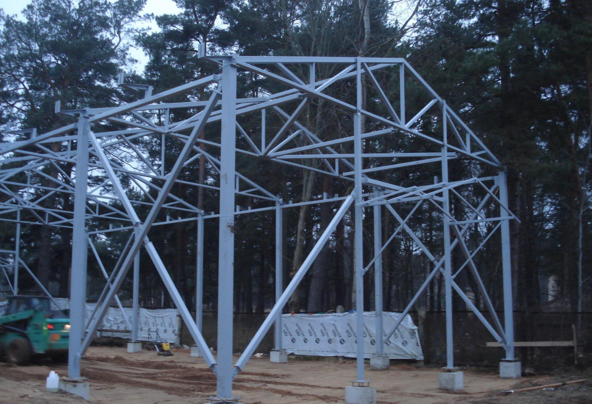
Celiņa izbūve Stropu ezera pludmalē