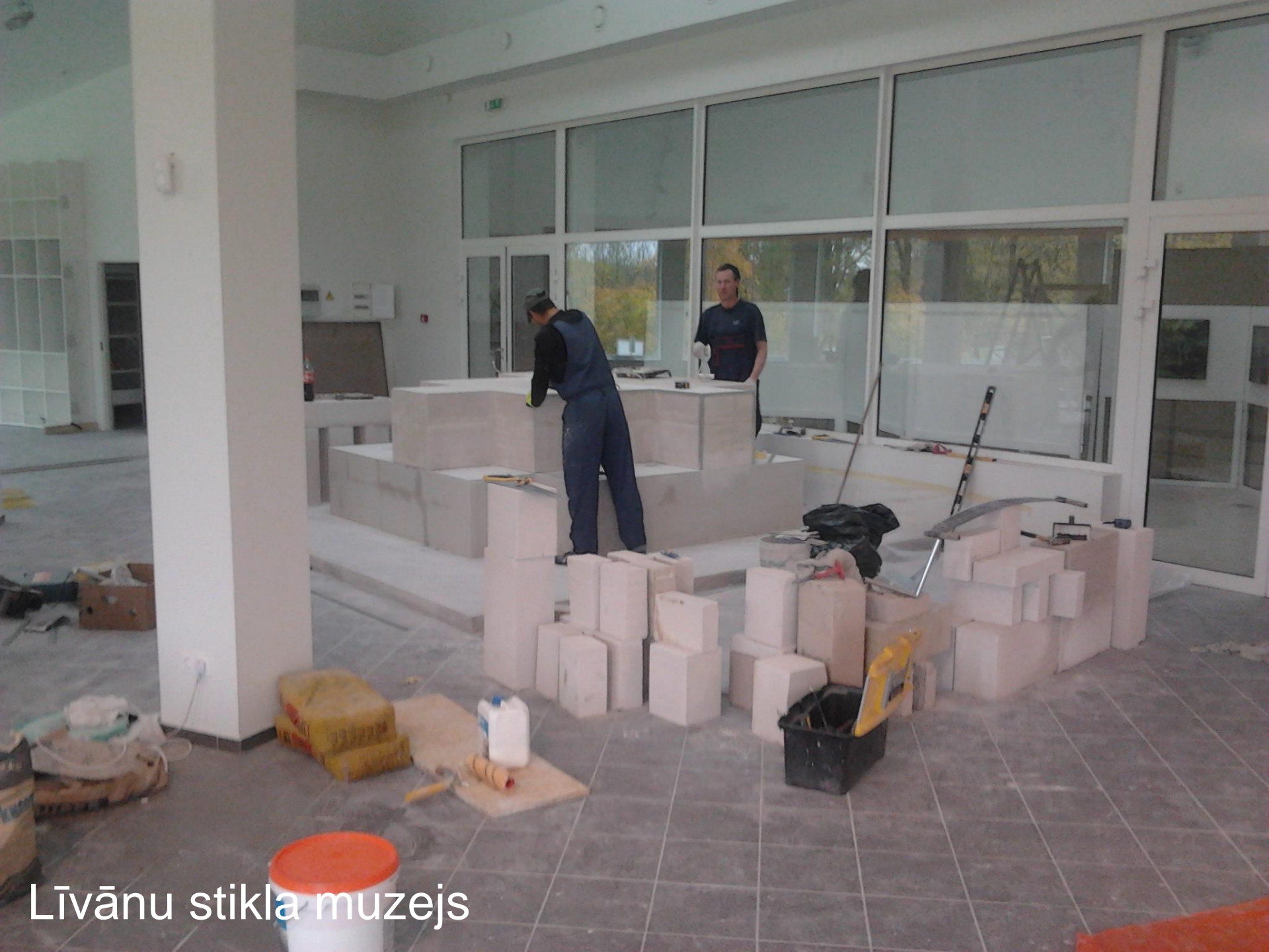
Līvānu stikla muzejs