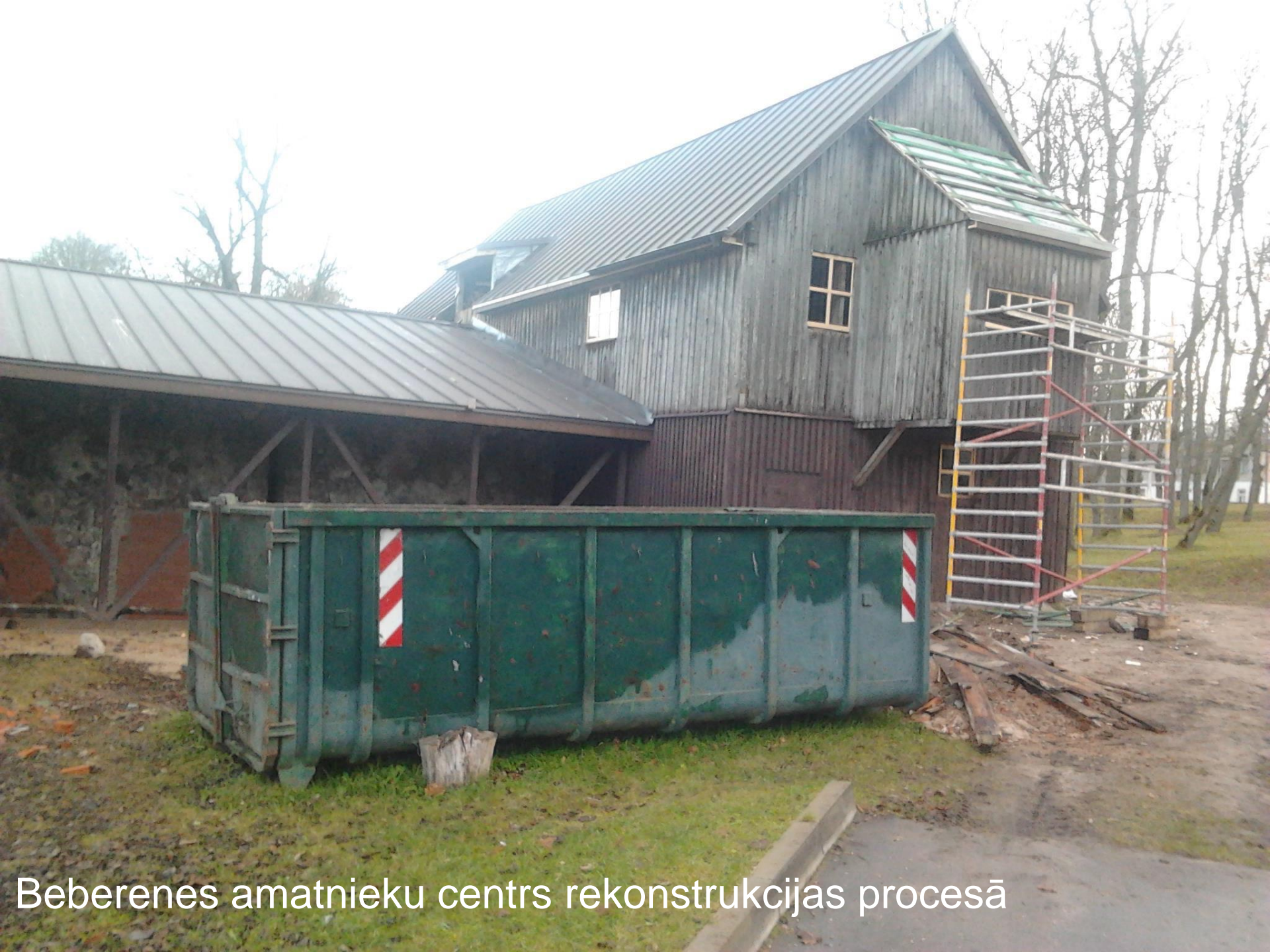
Beberenes amatnieku centrs rekonstrukcijas procesā