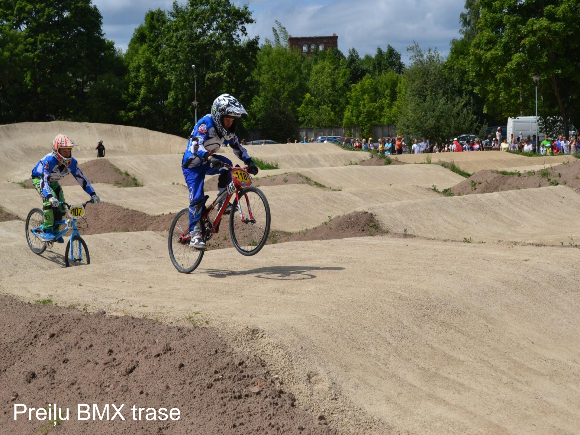
Preiļu BMX trase