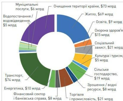
Рисунок 3. Загальний обсяг потреб на 1 червня 2022 року: 349 мільярдів доларів США

Слід також зауважити, що наслідком війни російської федерації проти України стало формування енергетичної кризи, продовольчої кризи та кризи з біженцями в багатьох країнах світу, а також інфляційних процесів у цілому по Європейському Союзу.