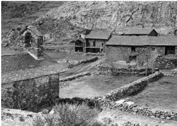
St. Pere del Tarter (1940- 2010)