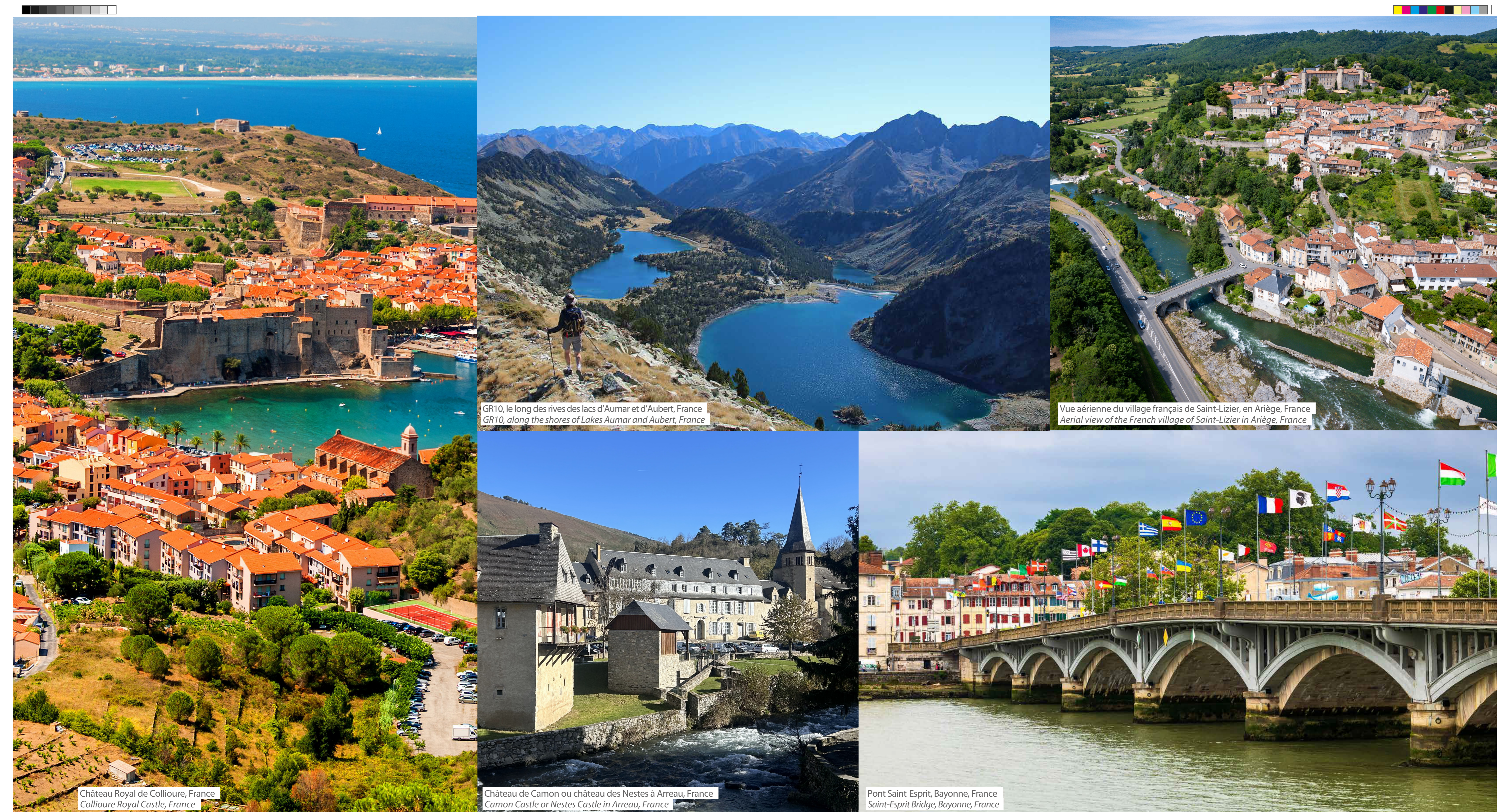
GR10, le long des rives des lacs d'Aumar et d'Aubert, France GR10, along the shores of Lakes Aumar and Aubert, France