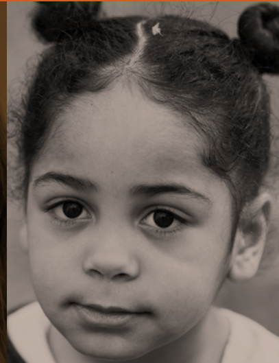
POLITIKAT E BASHKËRENDUARA