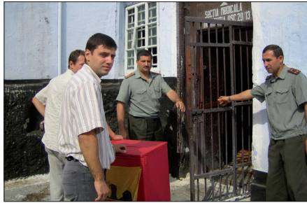
السلطات المحلية شركاء المؤتمر

وتشرف على وسائل الإعلام والمنتخبين المحليين والجمعيات والوضع الديمقراطي المحلي والإقليمي يقوم المؤتمر وبشكل دوري برقابة عامة لكل بلد. ويمكن أن ينظم في عمله مهام تحقيق للمؤتمر تتعلق بمشكلات مقلقة.