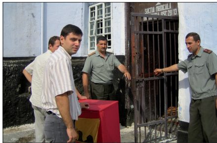
Une urne électorale circule dans une prison à Chisinau (Moldova). Le respect de la citoyenneté, même en prison, est le signe de la qualité de la démocratie locale dans un pays.

Dans son travail de monitoring, le Congrès s'appuie sur les associations nationales de pouvoirs locaux qui servent de système d'alerte précoce dans les Etats. Le droit des collectivités à se constituer en association est garanti par la Charte.