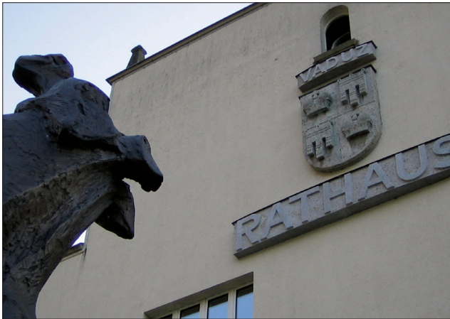
Rathaus de Vaduz à l'occasion d'une mission de monitoring de la démocratie locale au Liechtenstein.

La reconnaissance de la démocratie locale par les Etats membres du Conseil de l'Europe a conduit, en 1985, à l'adoption de la Charte européenne de l'autonomie locale. Ce texte affirme le rôle des collectivités comme premier niveau où s'exerce la démocratie. Il est devenu un traité international de référence dans ce domaine.