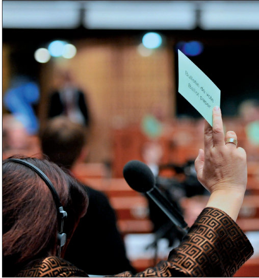
Le libre exercice du mandat d'un élu se manifeste aussi à travers son vote.

Il doit permettre la compensation financière adéquate des frais entraînés par l'exercice du mandat ainsi que, le cas échéant, la compensation financière des gains perdus ou une rémunération du travail accompli et une couverture sociale correspondante.