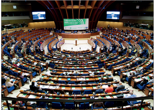
Les rapports de monitoring sont discutés et adoptés lors des sessions plénières du Congrès.

Le contrôle administratif des collectivités locales doit être exercé dans le respect d'une proportionnalité entre l'am-