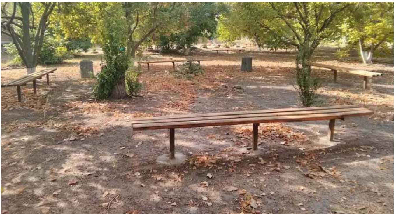
Завдяки проекту, профінансованому в рамках бюджету участі, тепер тут можна посидіти, обговорити нові ідеї та проекти