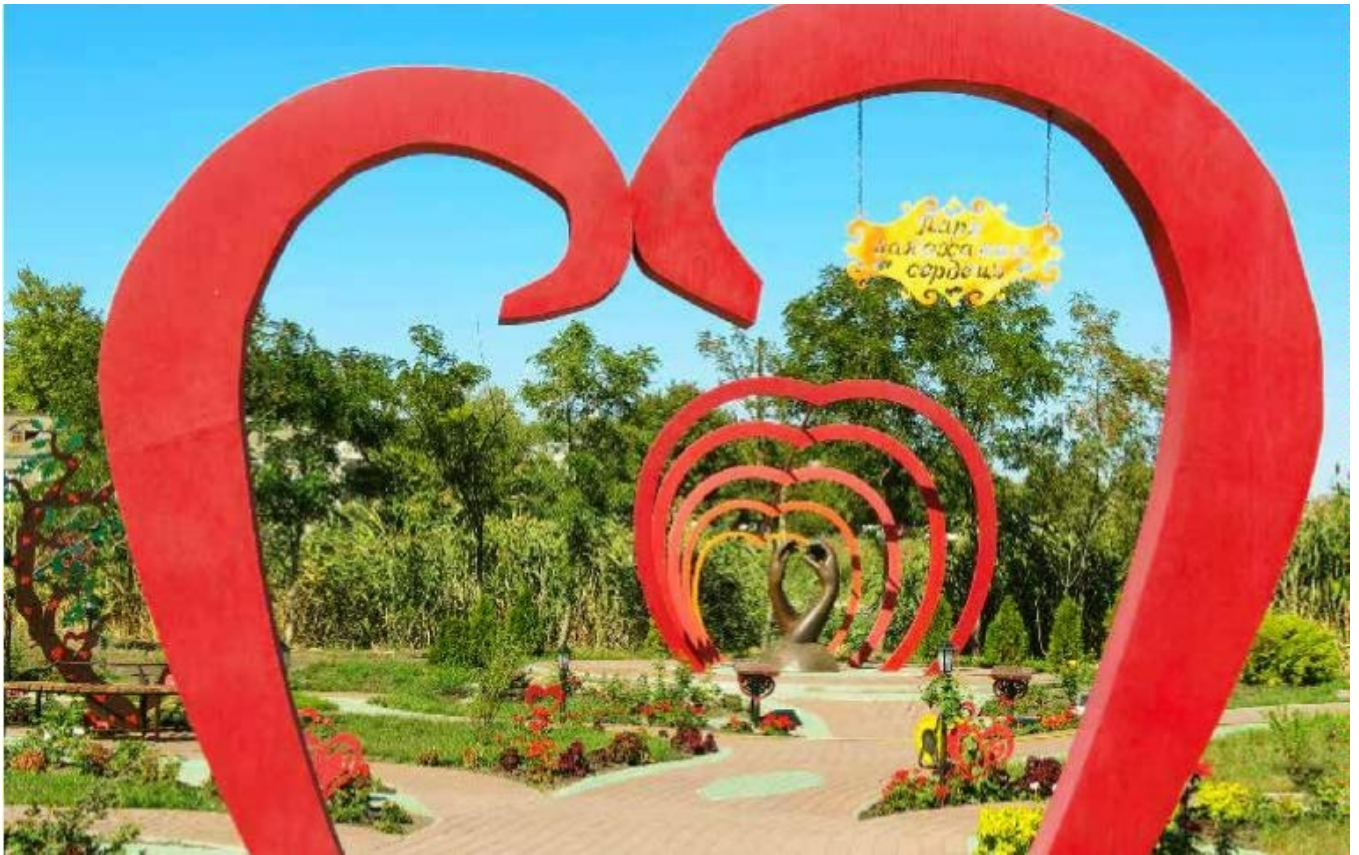
Де є любов, там є життя! (Парк Закоханих Сердечь)