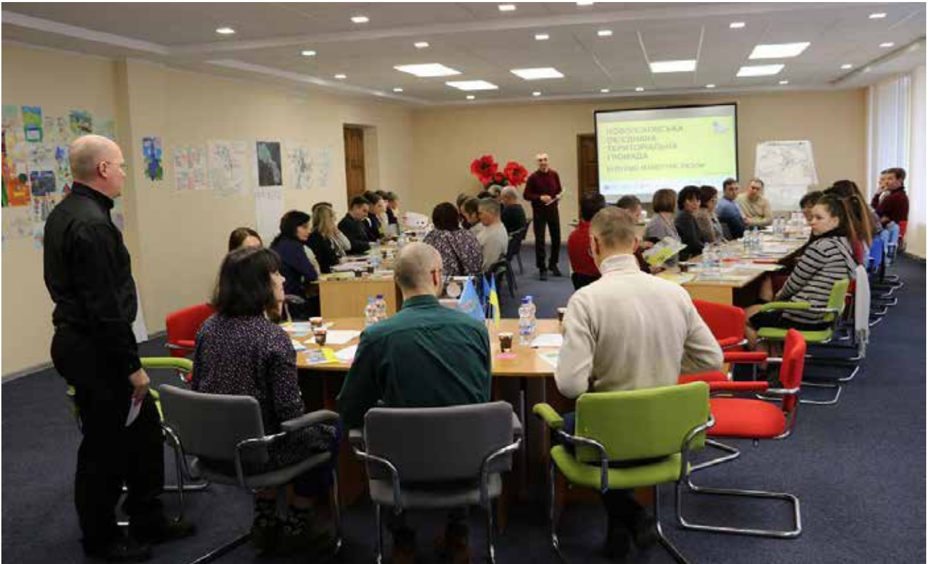
У громаді створено зручний (у т.ч. для людей із інвалідністю) мультифункціональний публічний простір для проведення тренінгів, семінарів, зустрічей влади з громадськістю: чергова зустріч, на якій влада разом з мешканцями працює над розбудовою громади