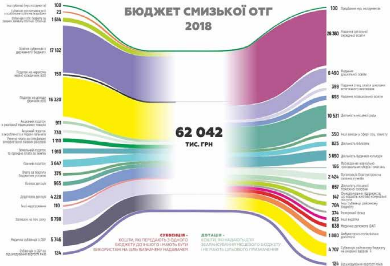
Титульна сторінка буклету та один з його розворотів: лаконічно та інформативно про головне