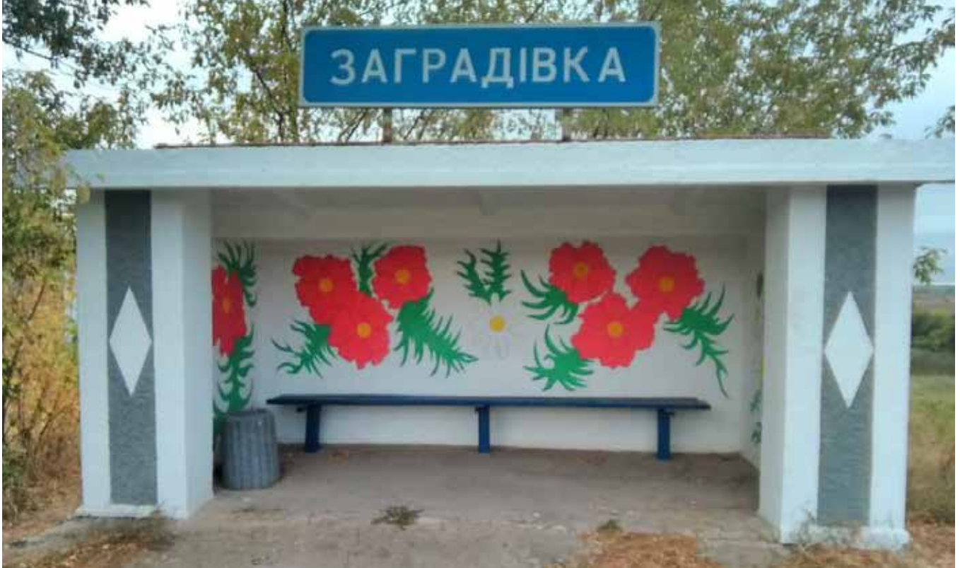
Автобусна зупинка оновлена й прикрашена за кошти громадського бюджету

завідувач сектору економічного розвитку та залучення інвестицій, Кочубеївська сільська рада ОТГ Херсонської області, тел. моб. +380683646218, е-пошта: tige1otg.ei@gmail.com