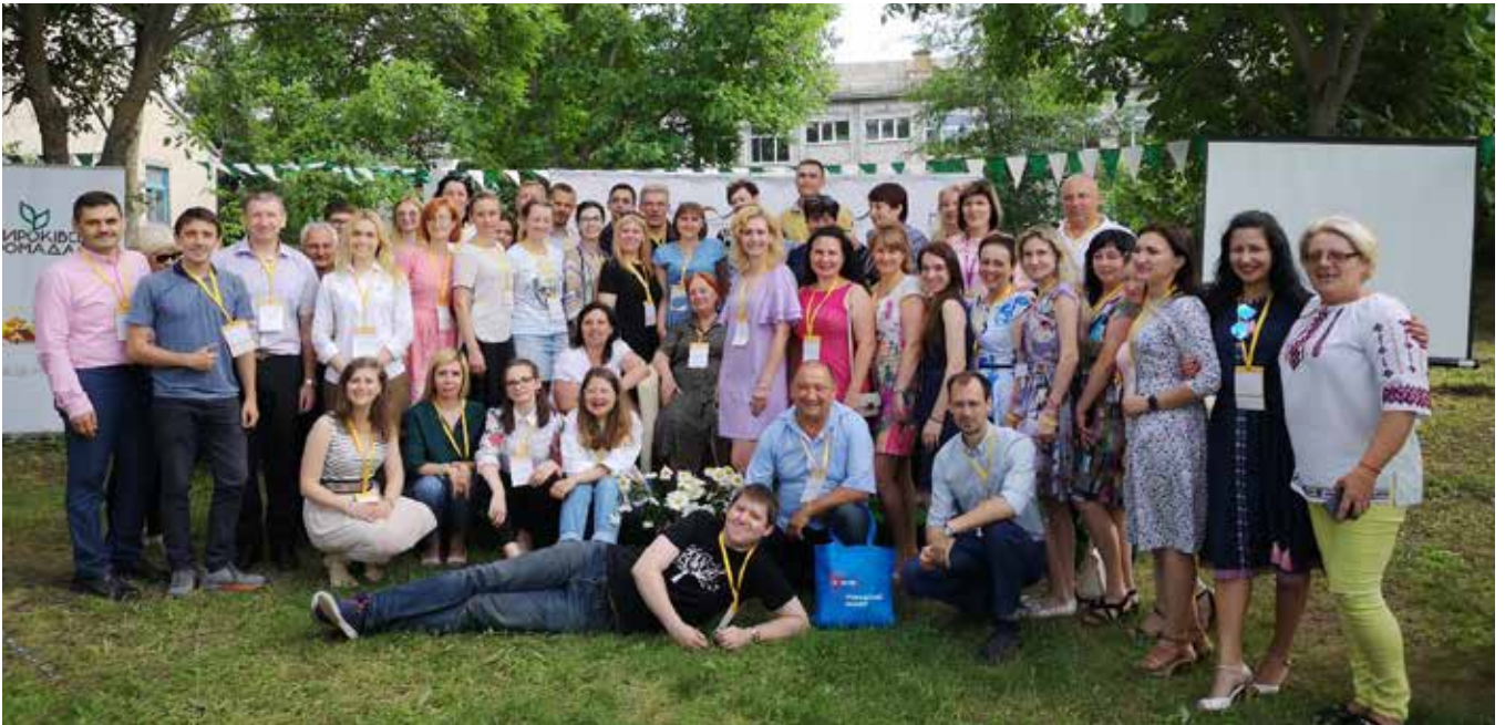
Учасники Першого східноукраїнського форуму практиків партиципації. Широківська ОТГ Запорізької області, червень 2019 року

моб. +380961127703, е-пошта: ldonos81@gmail.com