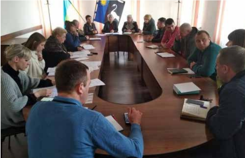
Засідання комісії міської ради з відбору проектів для фінансування в рамках Громадського бюджету