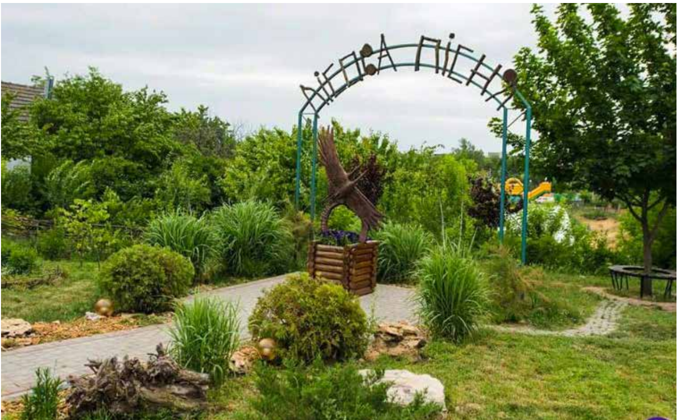
Я потопая у красі Твоїй!.. (Етнопарк «Лісова пісня»)