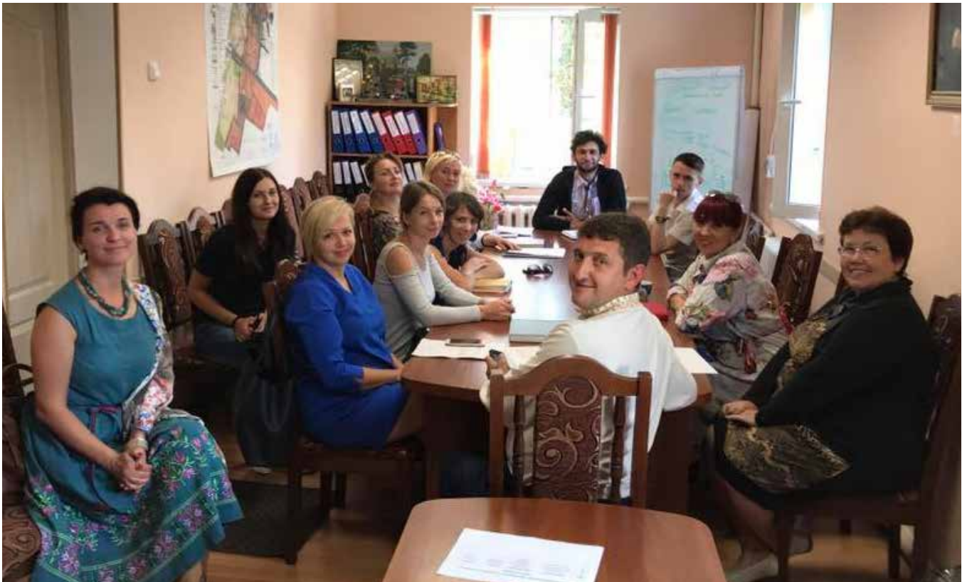
Засідання спеціалізованої громадської ради з розвитку культури при Немішаївській селищній раді