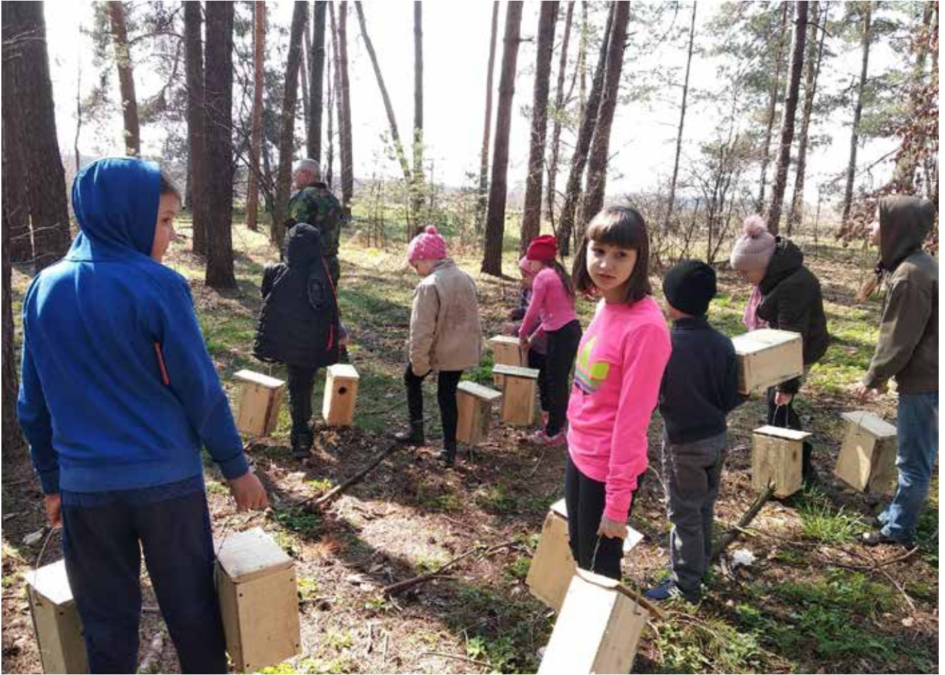
Пізнавальні уроки «Природа дихає життям» - це не лише теорія, а й практика