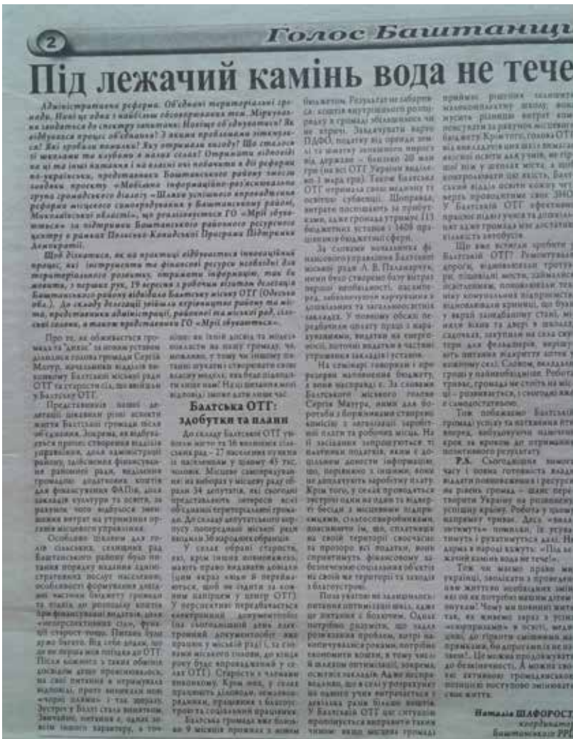
Про діяльність мобільної інформаційної групи навіть писала районна газета «Голос Баштанщини» (№86 за 29 вересня 2016 року)