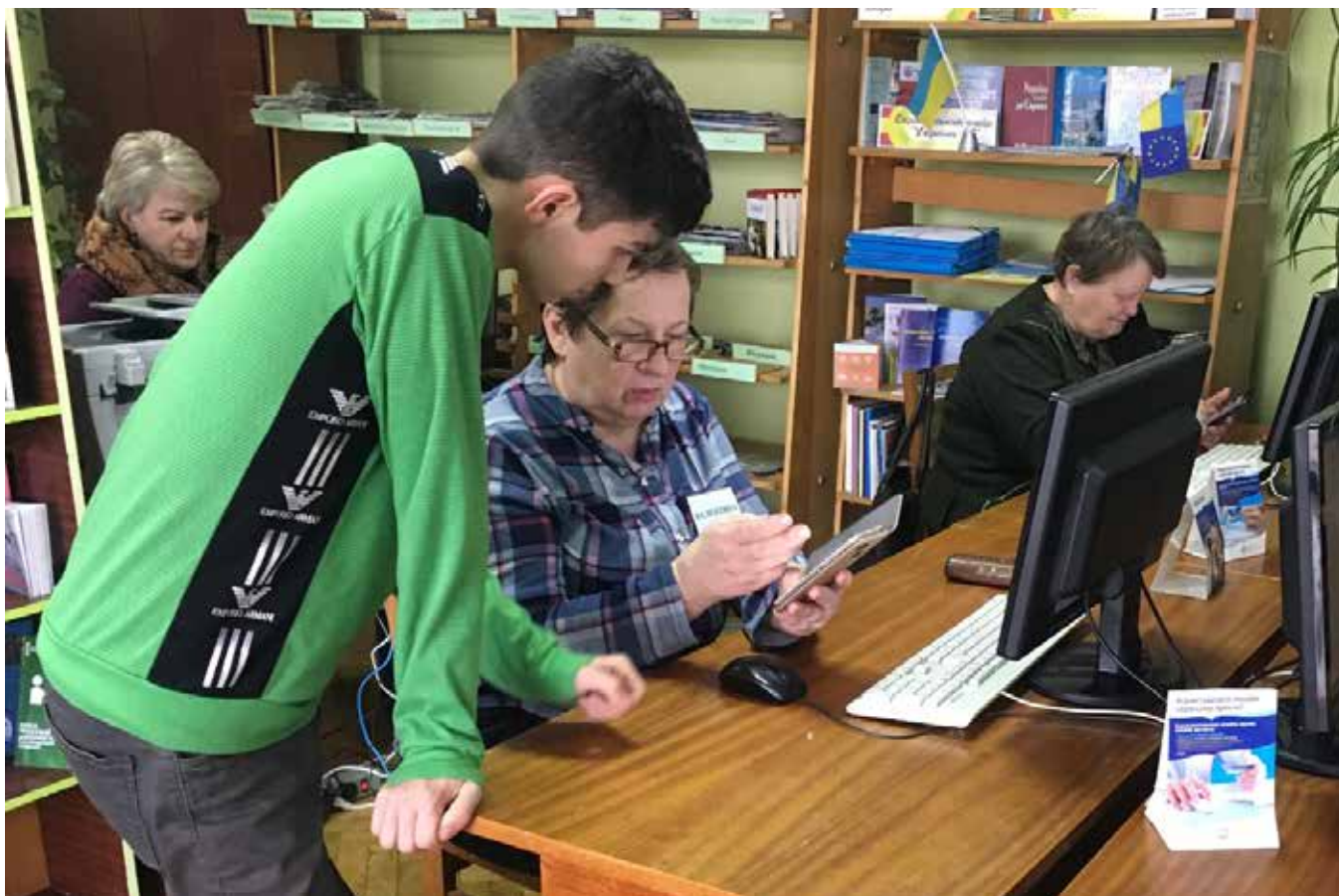
Передача досвіду від молодшого покоління старшому: освоєння сучасних гаджетів