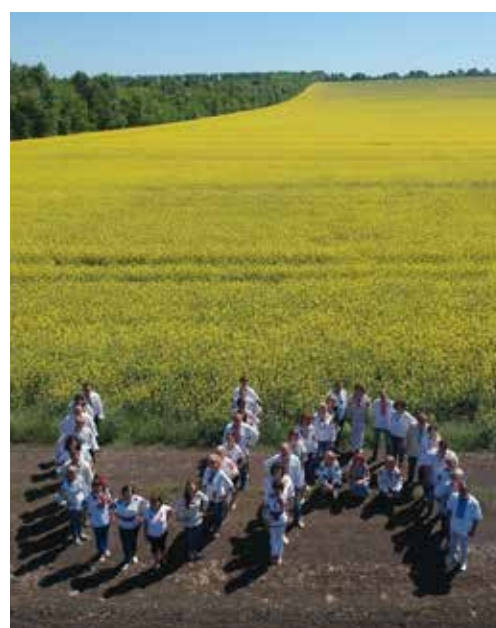
День вишиванки, 2018 рік