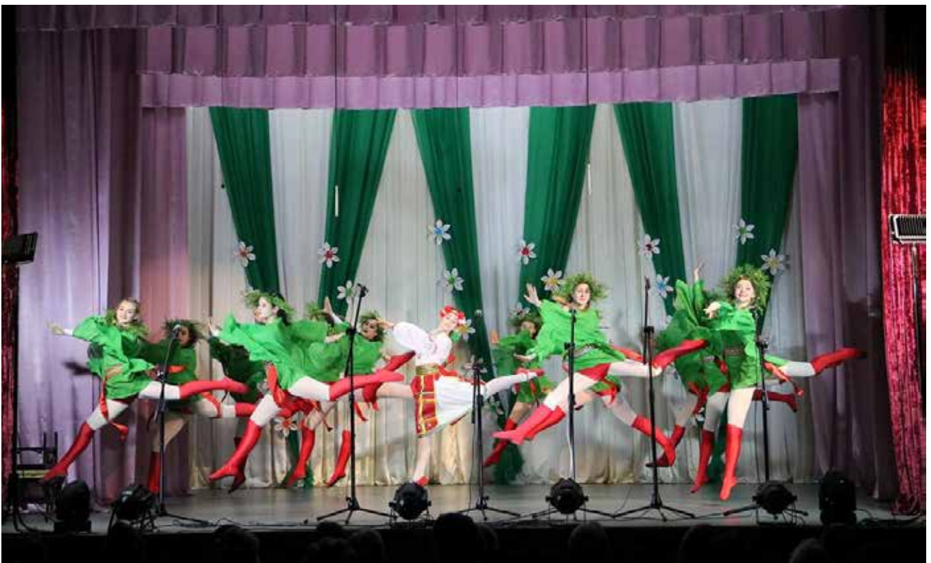
У громаді створено комфортні умови для розвитку творчих здібностей у дітей та молоді: виступ зразкової хореографічної студії «Едельвейс» «Центру культури, дозвілля, туризму і спорту Новосковської селищної ради»