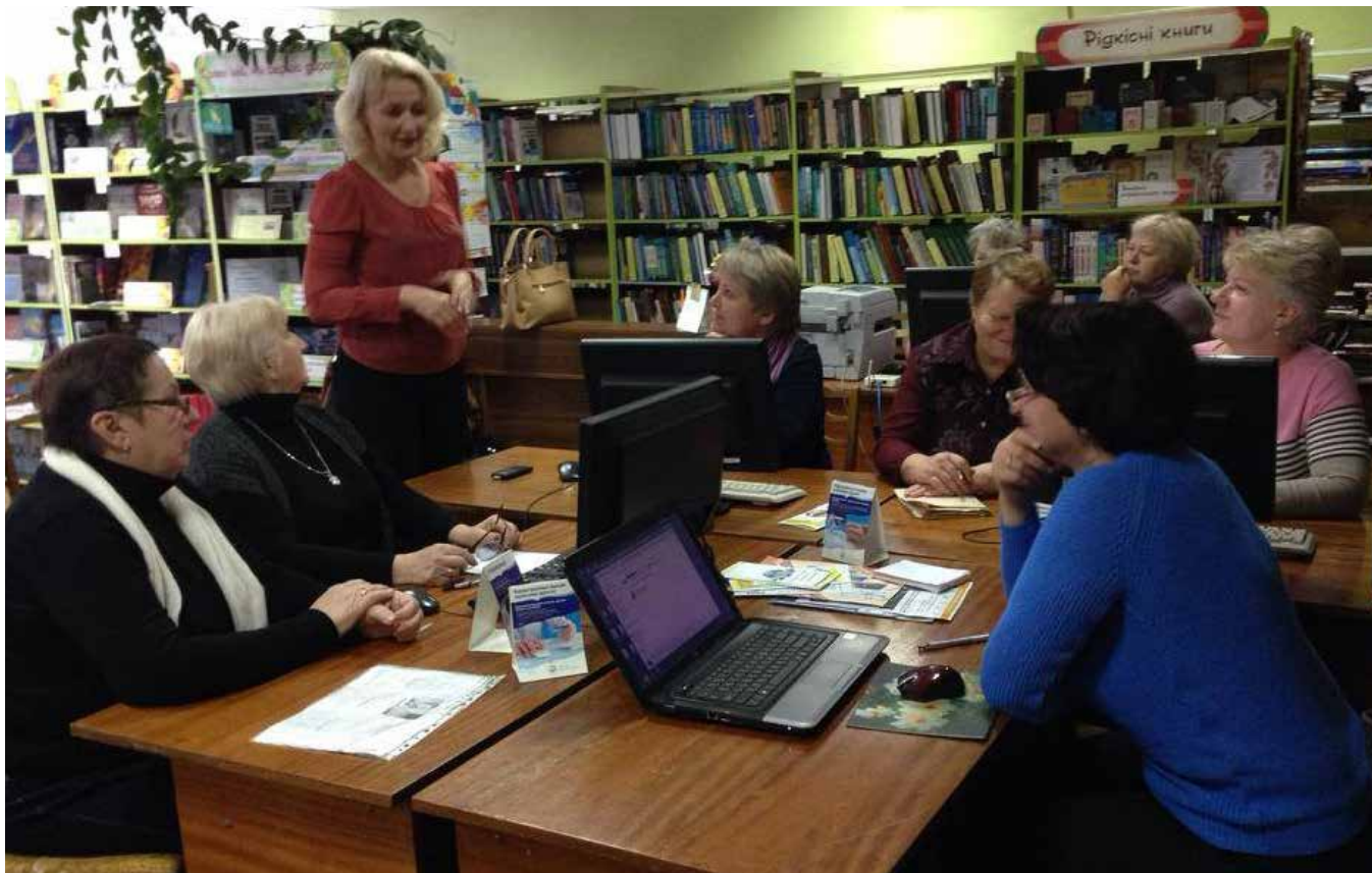
Бібліотека стає місцем, де навчаються: Заняття в Університеті третього віку