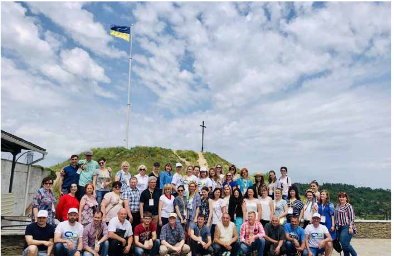
Підписання Меморандуму зі створення Асоціації учасницьких громад. 7 червня 2019 року, острів Хортиця