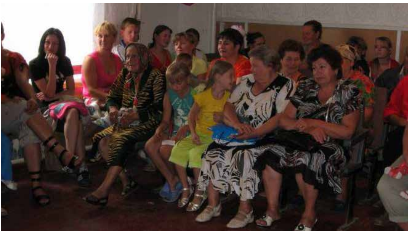
Чергова, одна із дев'ятнадцяти виїзних інформаційних зустрічей в громадах: обговорюється питання щодо надання згоди громади на об'єднання в ОТГ