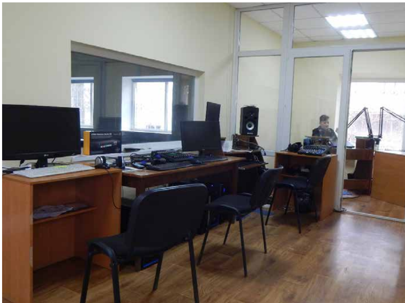
Студія Телерадіокомпанії «Тростянець»