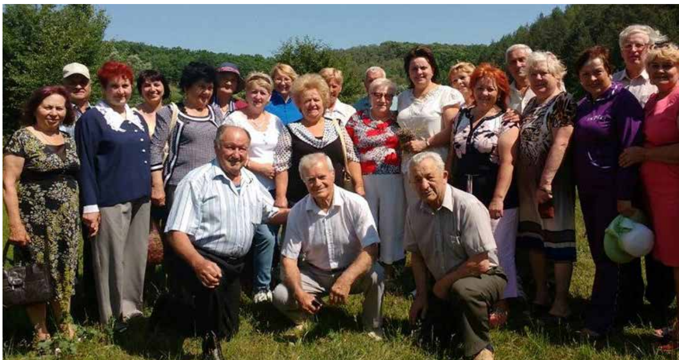
Засідання спеціалізованої громадської ради з розвитку культури при Немішайвській селищній раді