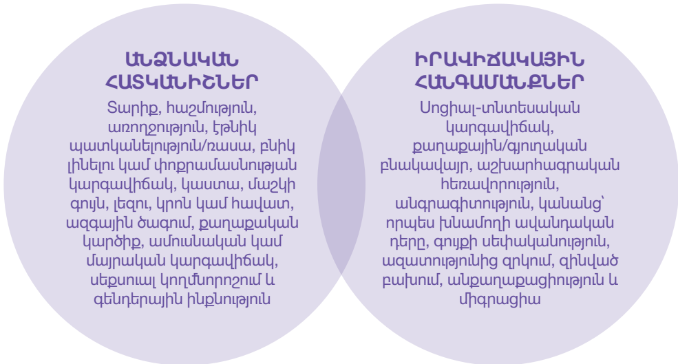
Նկար 2. Կանանց համար արդարադատության մատչելիության սոցիալական, մշակութային և տնտեսական խոչընդոտները